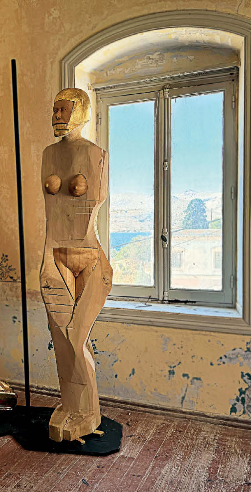
● Το γλυπτό του Πολωνού Πάβελ Αλτκάμερ και η μικρή κλίμακας εγκατάσταση με φθαρτά υλικά της Νερμίν Ερ.