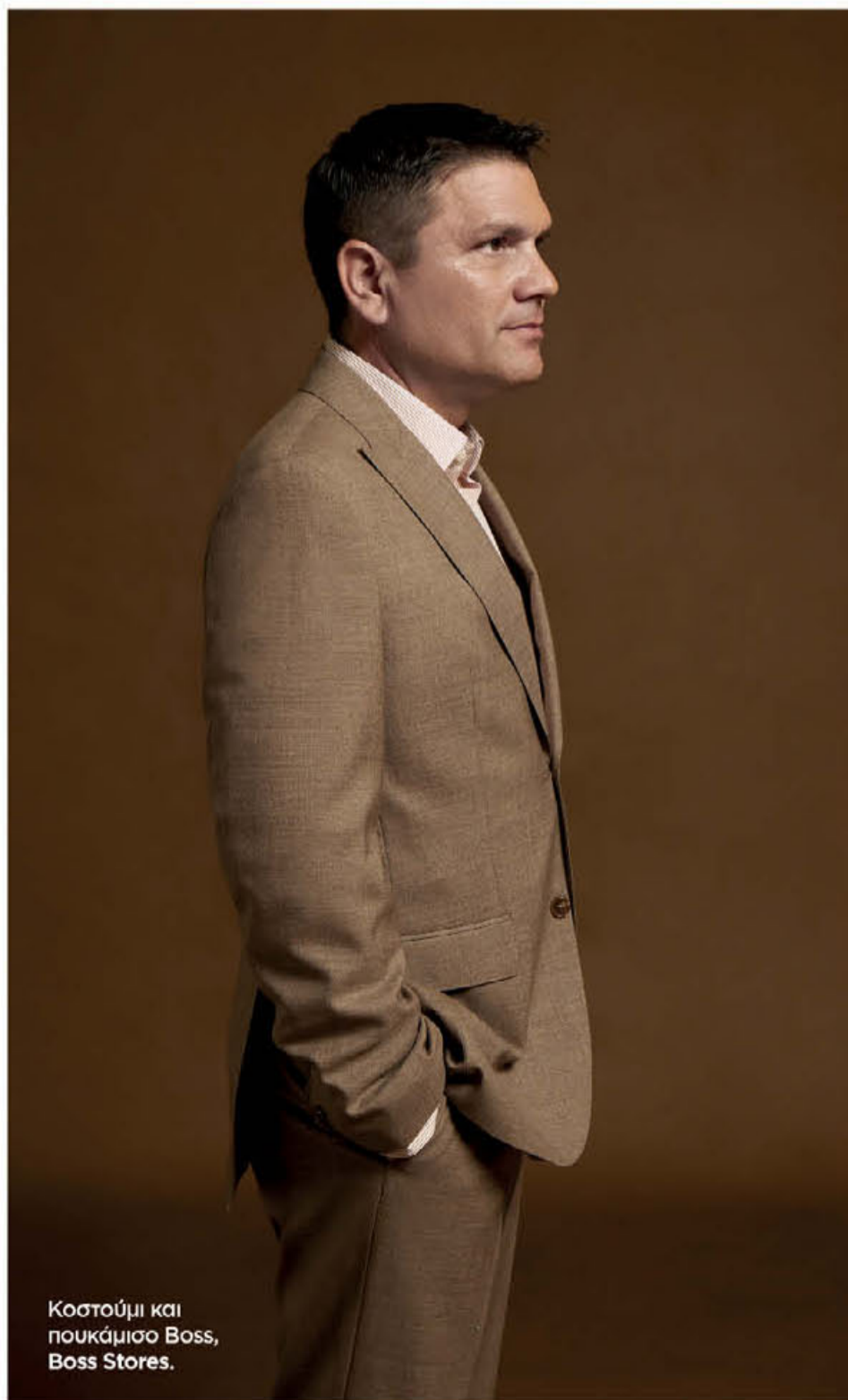
Κοστούμι και πουκάμισο Boss, Boss Stores.