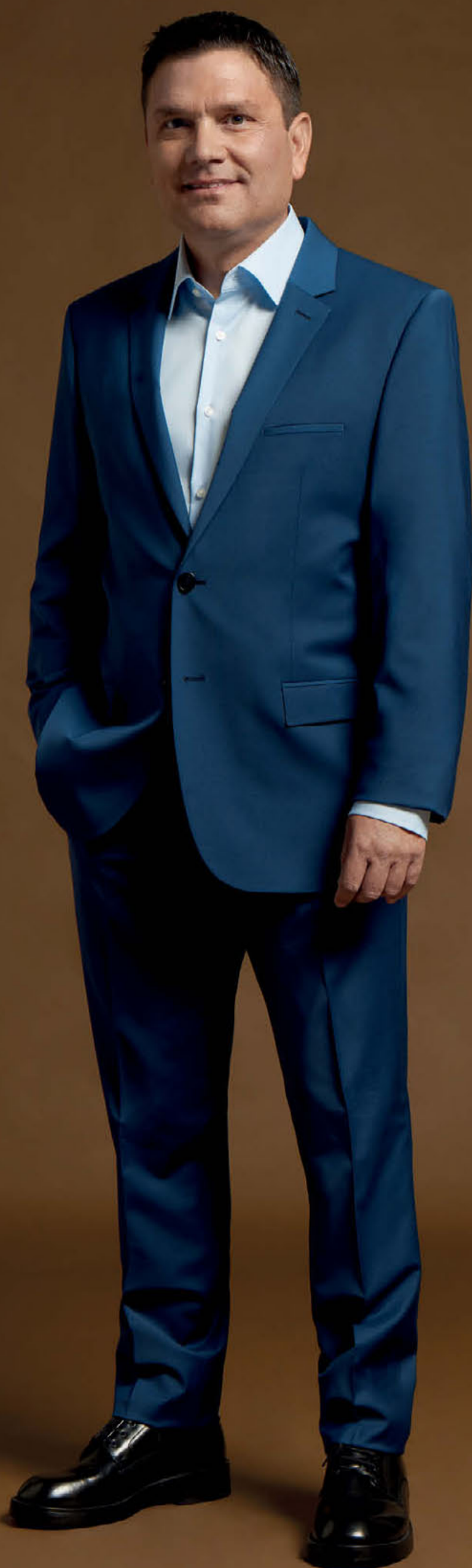
Κοστούμι Boss, Boss Stores.