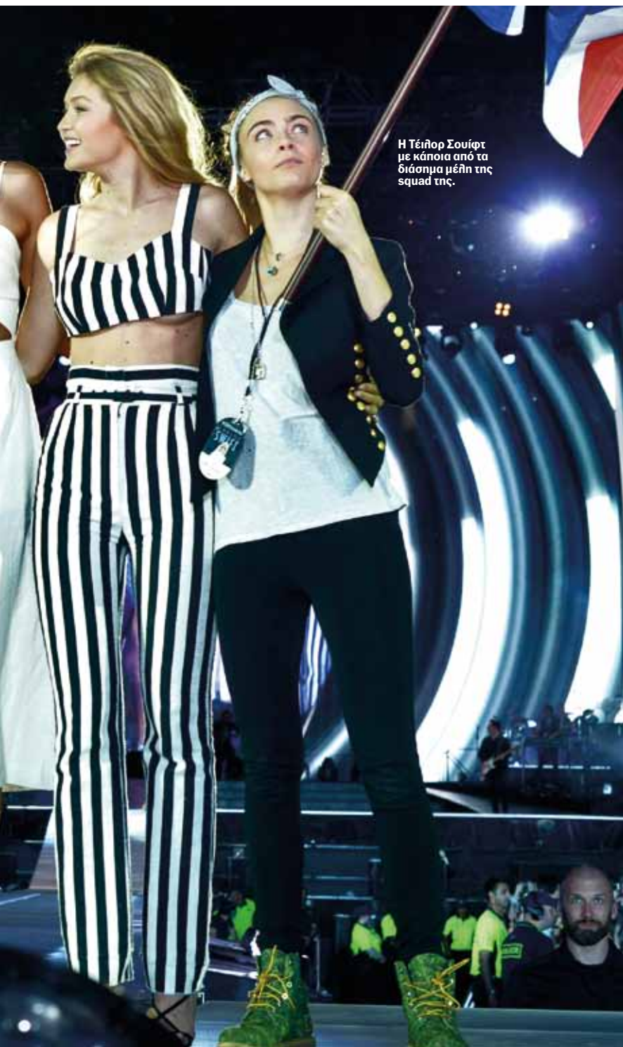
Η Τέιλορ Σουίφτ με κάποια από τα διάσημα μέλη της squad της.