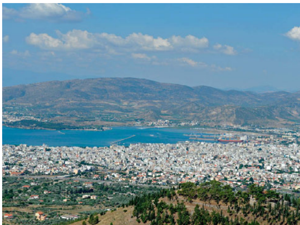
Ο Βόλος από ψηλά

Από το Βόλο στο Πήλιο, ένα μαγευτικό ταξίδι στο χώρο και στο χρόνο