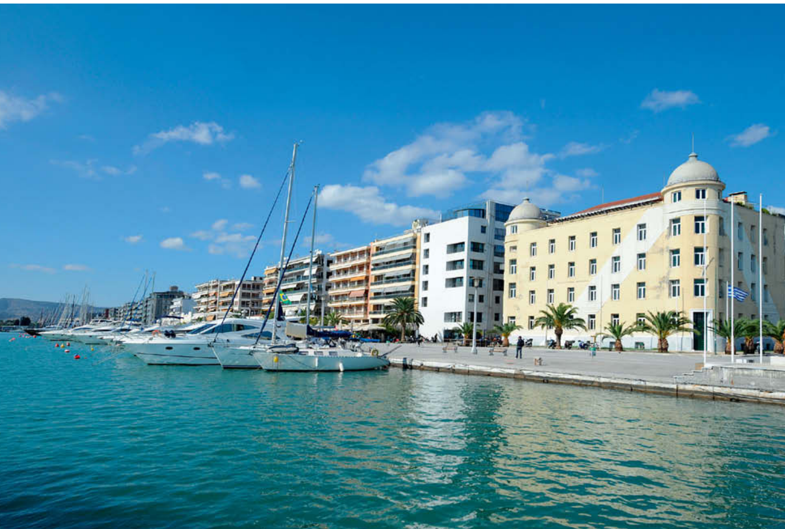
Η πόλη του Βόλου