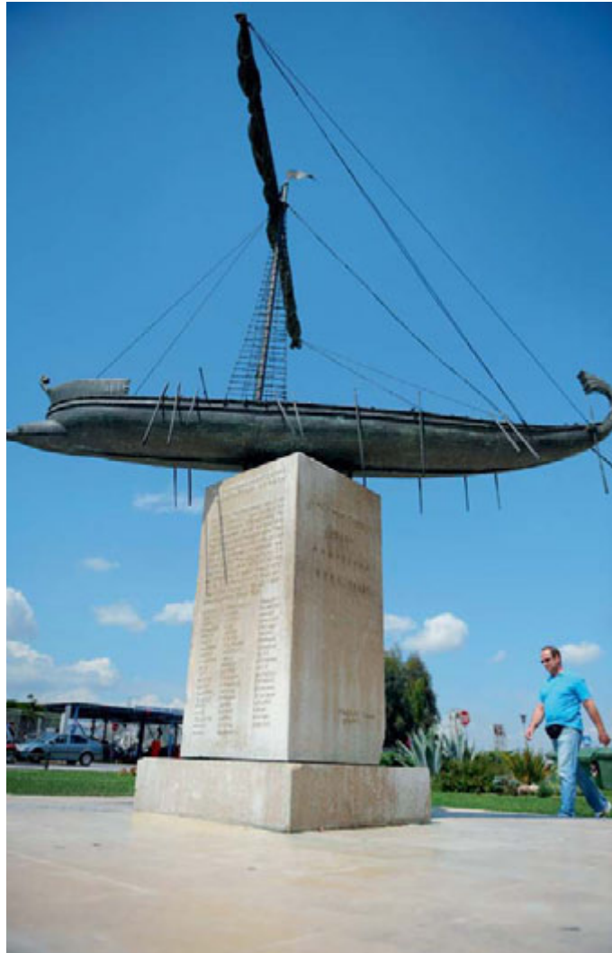
Χάλκινο ομοίωμα Αργούς