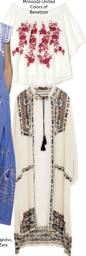
Μηλούζα United Colors of Benetton