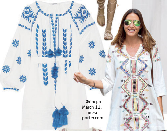
Φόρεμα March 11, net-a- -porter.com