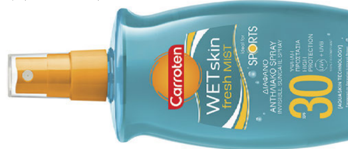
Διάφανο Wet Skin Fresh Mist SPF 30 της Carrotten