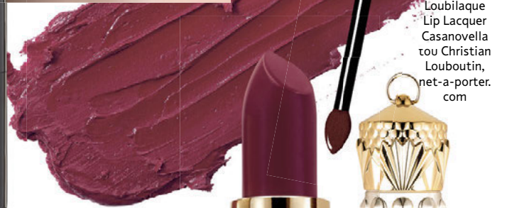
Loubilaque Lip Lacquer Casanovella του Christian Louboutin, net-a-porter.com