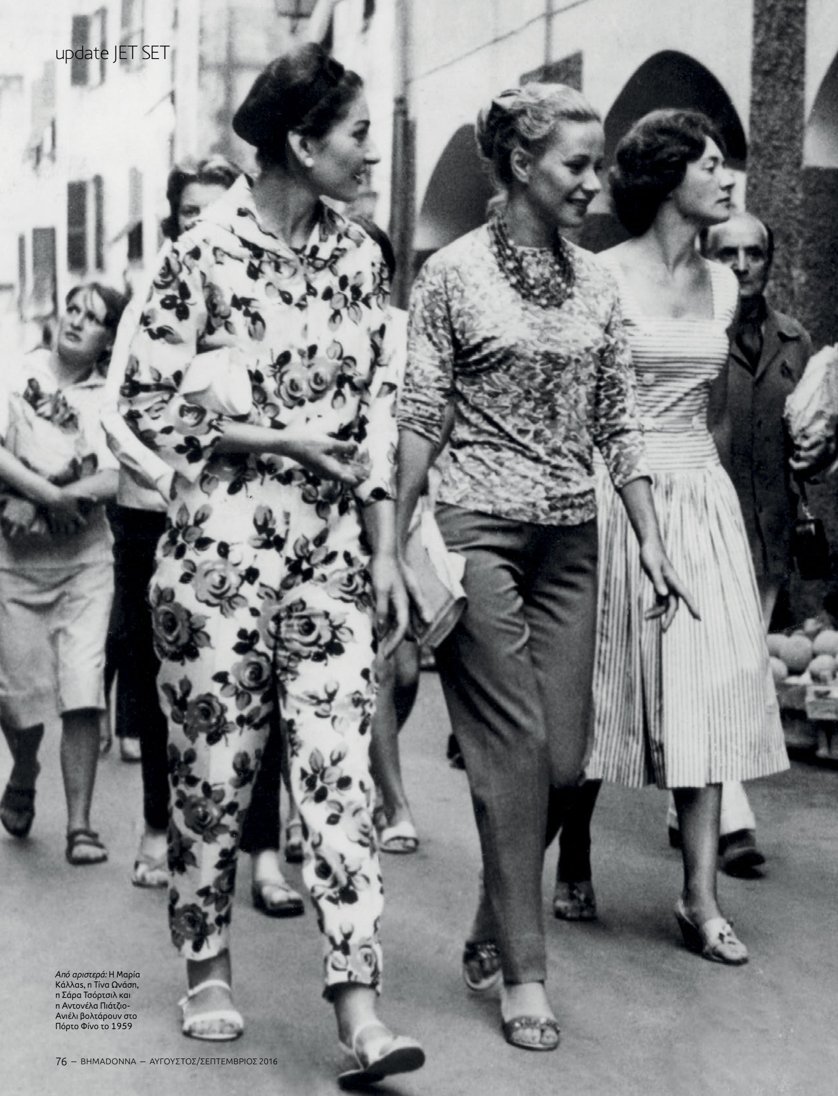
Από αριστερά: Η Μαρία Κάλλας, η Τίνα Τνάση, η Σάρα Τσόρτσιλ και η Αντονέλα Πιάτζιο-Ανιέλι βολτάρουν στο Πόρτο Φίνο το 1959