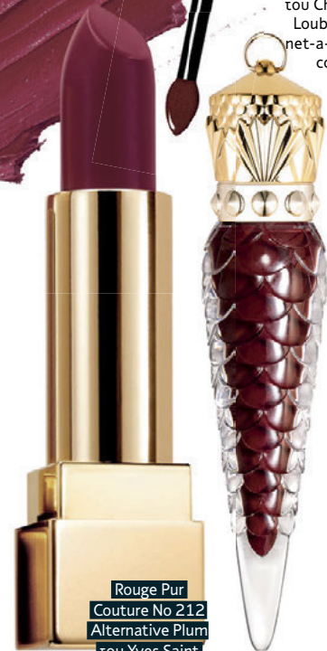
Rouge Pur Couture No 212 Alternative Plum του Yves Saint Laurent

Στα '90s, όταν τα άγρια κορίτσια έμπαιναν στην punk σκηνή και μια νέα γενιά γυναικών επαναπροσδιόριζε το φεμινισμό, το σκούρο κραγιόν είχε γίνει συνώνυμο της δύναμης. Δεν ήταν έκπληξη όμως που από σύμβολο αντίδρασης πήρε πρώτη θέση στις πασαρέλες και φορέθηκε από τις πιο ατίθασες σταρ του Χόλιγουντ. Κόκκινο Βουργουνδίας, κερασί, μελιτζάνι, μπορντό έως και μαύρο, το σκούρο χρώμα στα χείλη κατέκλυσε τα σόου για την ερχόμενη σεζόν φθινόπωρο/χειμώνας 2016-2017. Το look δίνει ένα μήνυμα ελευθερίας και αυτοπεποίθησης. Κάτι από γκόθικ, κάτι από Άλις Κούπερ, κάτι από βικτωριανή εποχή, στην πιο εκλεπτυσμένη