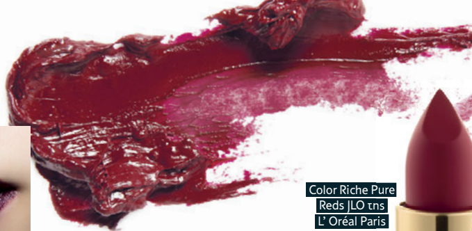
Color Riche Pure Reds JLO tns L'Oréal Paris