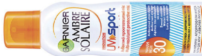
Ανθεκτικό στο νερό UV Sport Mist SPF 30 Ambre Solaire της Garnier