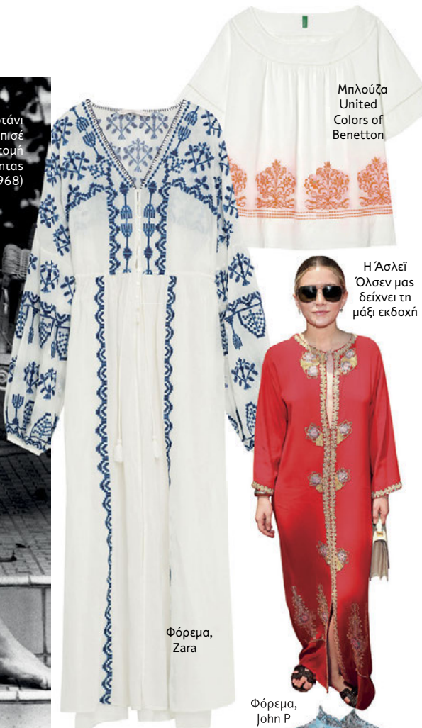
Μπλούζα United Colors of Benetton