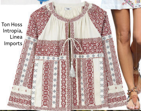
Ton Hoss Intropia, Linea Imports