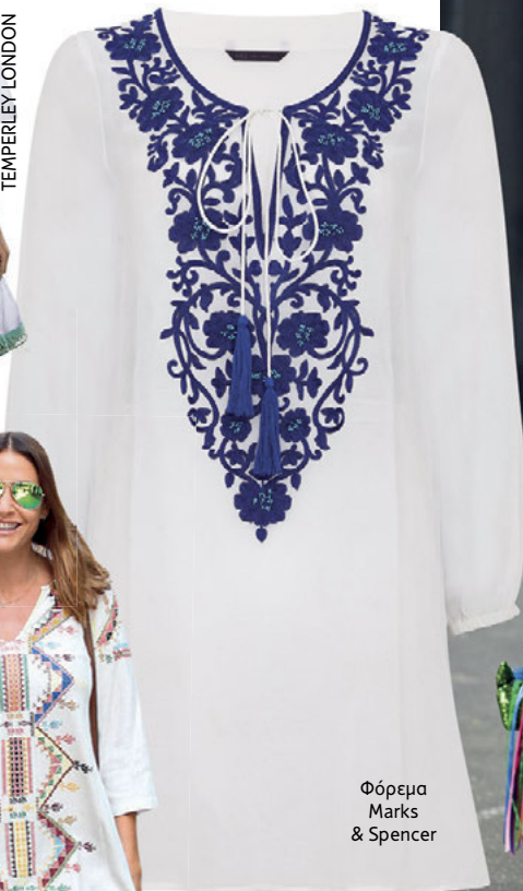
Φόρεμα Marks & Spencer