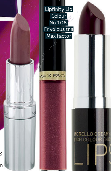
Matte Lasting Lipstick 38 tns Seventeen