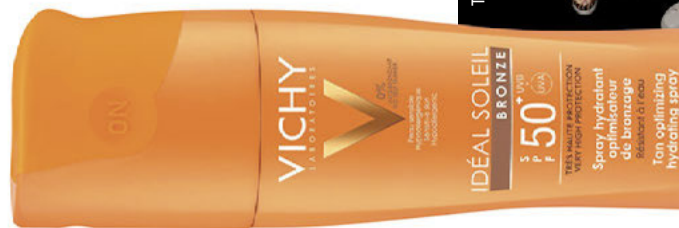
Αδιάβροχο σπρέι βελτιστοποίησης μαυρίσματος Idéal Soleil Bronze SPF 50+ της Vichy