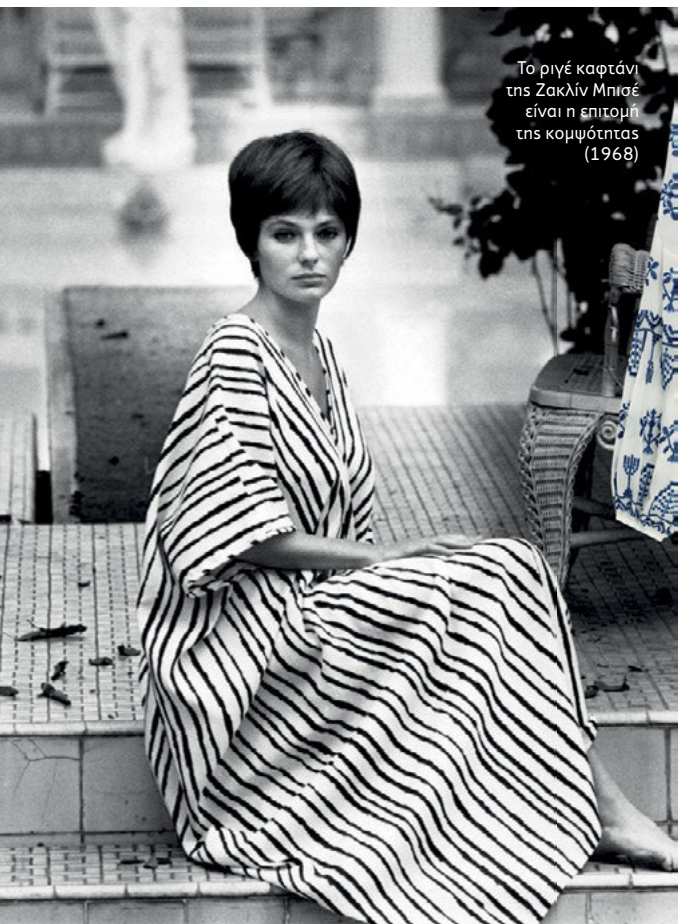
Το ριγέ καφτάνι της Ζακλίν Μπισέ είναι η επιτομή της κομψότητας (1968)