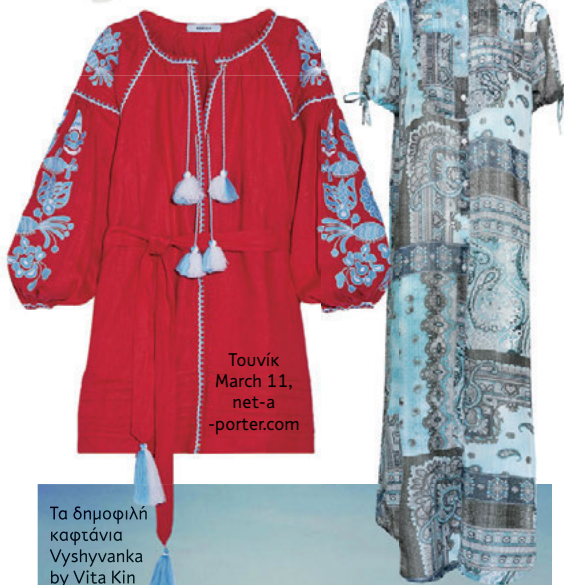
Τουνίκ March 11, net-a-porter.com