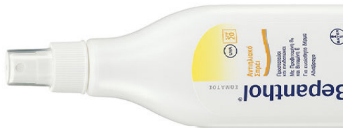
Με προβιταμίνη B5 και βιταμίνη E Bepanthol SPF 20 της Bayer