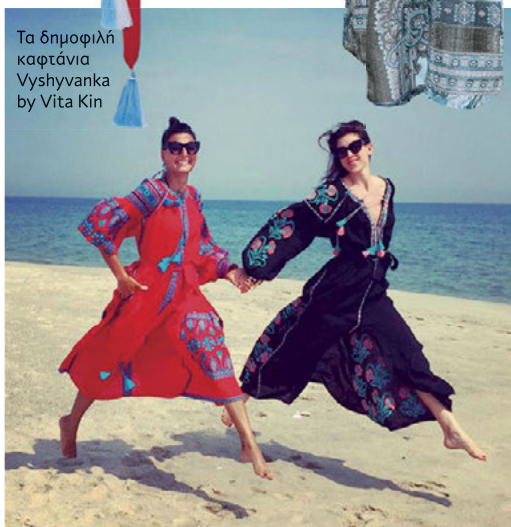
Τα δημοφιλή καφτάνια Vyshyvanka by Vita Kin