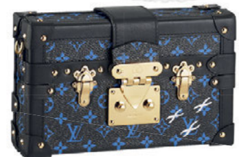
Τσαντάκι, Louis Vuitton