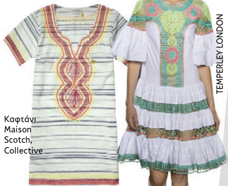
Καφτάνι Maison Scotch, Collective