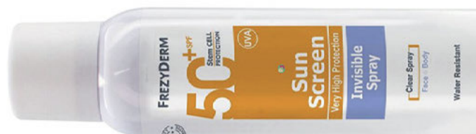
Αδιάβροχο σπρέι για το πρόσωπο και το σώμα Sun Screen Invisible Spray SPF 50+ της Frezyderm