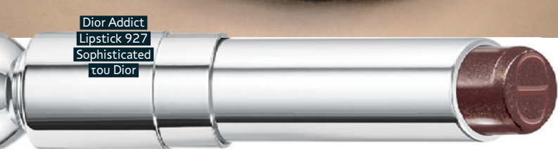
Dior Addict Lipstick 927 Sophisticated του Dior