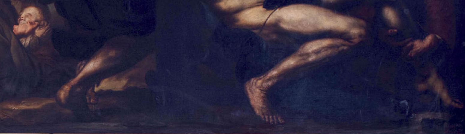
1588 RIBERA Joseph de J. Espagnol 1656 LE MARTYRE de S t BARTHELEMY Madrid - Museo de Prado Copie par W. LAYRAUD