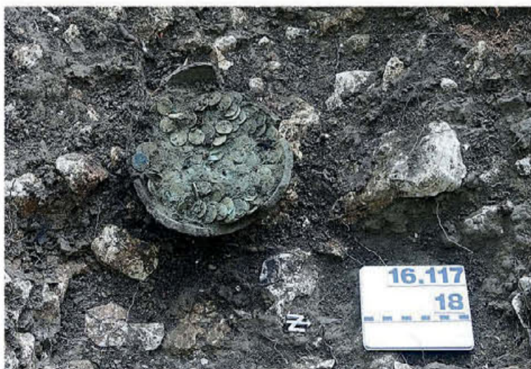
Ρωμαϊκά νομίσματα που έχουν βρεθεί στις Ελβετικές Άλπεις.

διαδικασία: η λέξη «ausgeapert» περιγράφει ό,τι αποκαλύπτεται από την τήξη του χιονιού ή του πάγου. Οι ανακαλύψεις αποκαλύπτουν πόσο εφευρετικοί χρειάστηκαν να γίνουν οι μακρινοί πρόγονοί μας προκειμένου να διασχίσουν τις δύσβατες κορυφογραμμές και τα περάσματα των Άλπεων. Είτε μιλάμε για εμπόριο και κυνήγι είτε για στρατιωτικές αποστολές, μετανάστευση και θρησκευτικές πρακτικές, η ανθρώπινη παρουσία στα βουνά αποδεικνύεται διαχρονική. Μεταξύ άλλων, έχει βρεθεί εκεί το παλαιότερο χιονοπέδιλο στον κόσμο (ηλικίας σχεδόν 6.000 ετών), καθώς και ρωμαϊκά νομίσματα που προσφέρονταν ως τάματα σε «ορεισίβιους» θεούς, πιθανότατα από φόβο για τις χιονοστιβάδες και τις κατολισθήσεις βράχων. Το ίδιο το ορεινό περιβάλλον,