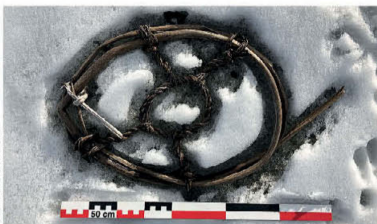
● Χιονοπέδιλο αλόγου ηλικίας 1.700 ετών.