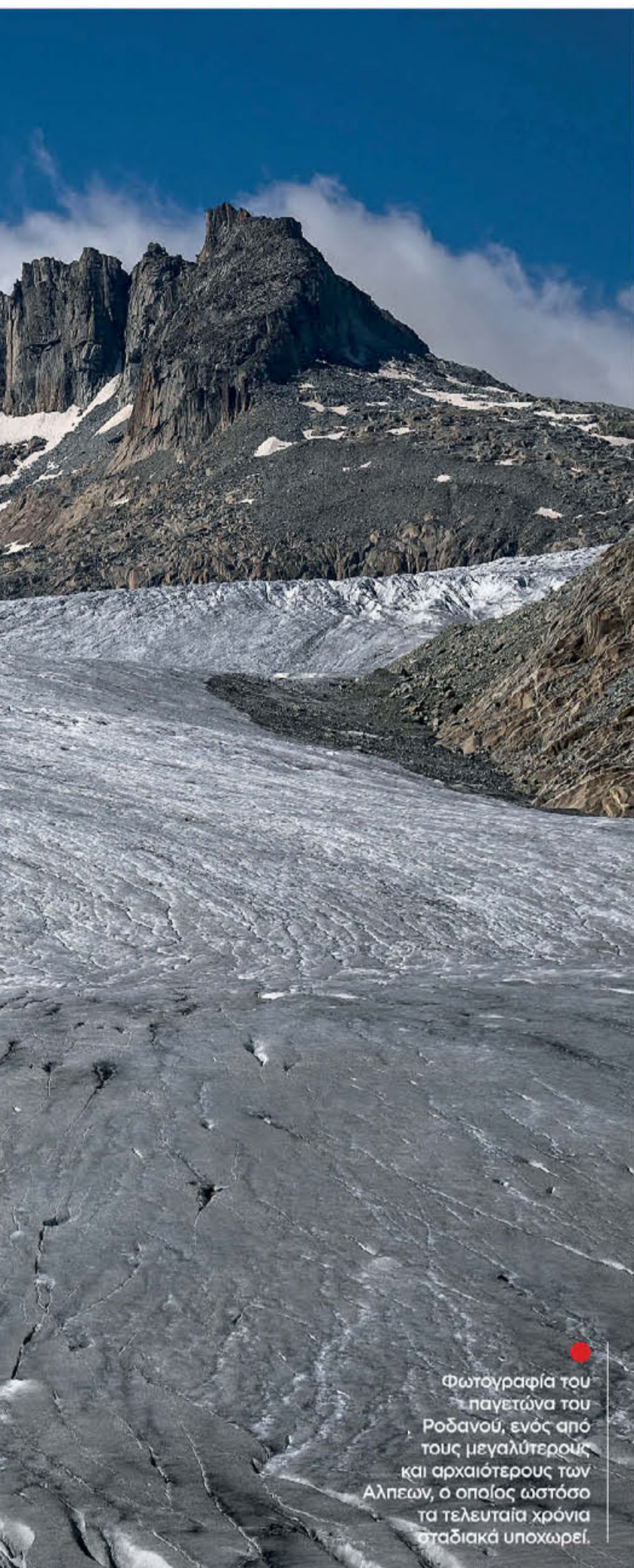
Φωτογραφία του παγετώνα του Ροδανού, ενός από τους μεγαλύτερους και αρχαιότερους των Αλπεων, ο οποίος ωστόσο τα τελευταία χρόνια σταδιακά υποχωρεί.

κές γραμμές και τούνελ. Τότε, οι αρχαίες διαβάσεις έχασαν οριστικά τη στρατηγική τους σημασία, όπως διαβάζουμε σε ένα πολύ εμπειριστωμένο και ενδιαφέρον ρεπορτάζ του BBC.