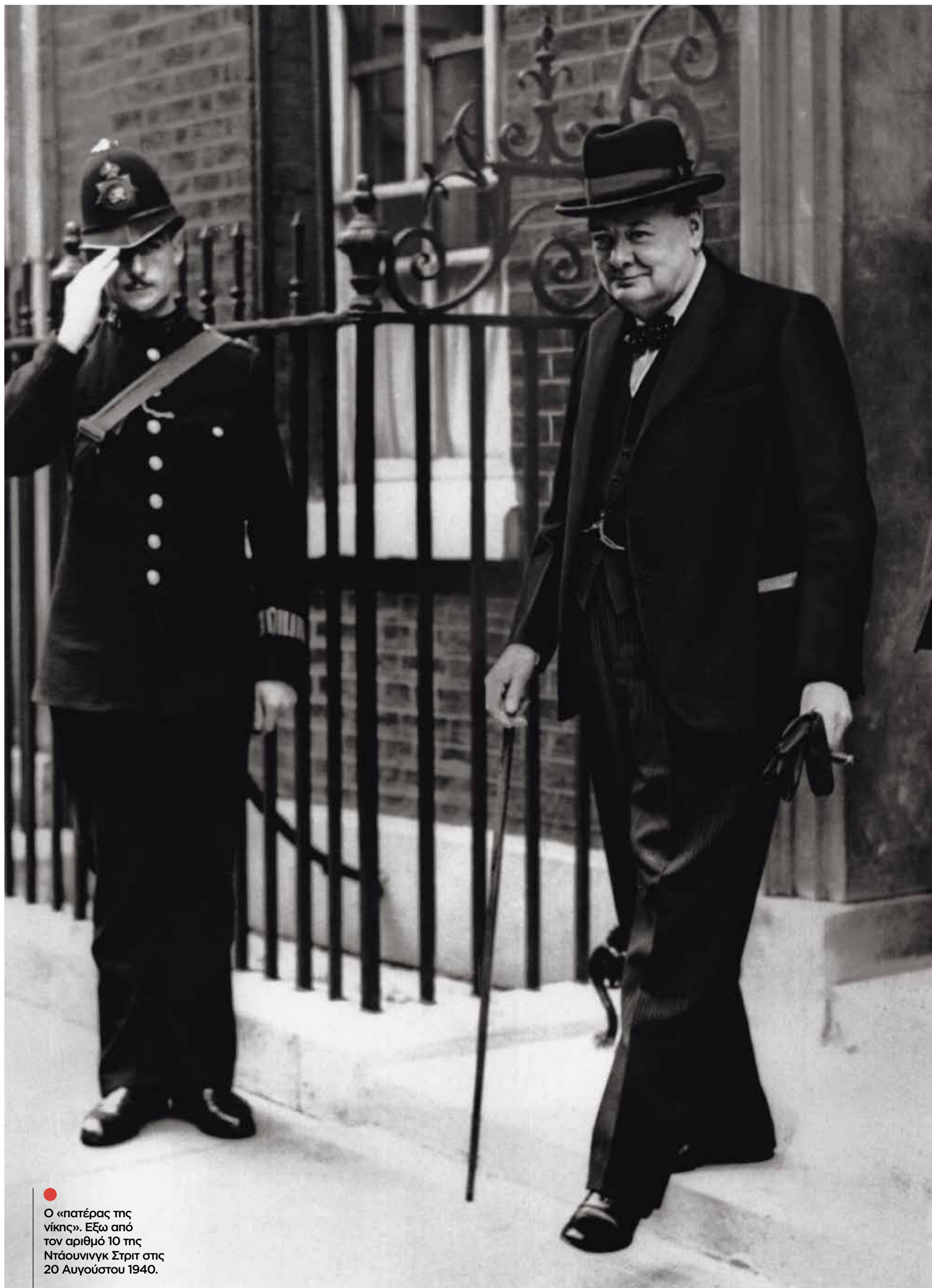
● Ο «πατέρας της νίκης». Εξω από τον αριθμό 10 της Ντάουνινγκ Στριτ στις 20 Αυγούστου 1940.