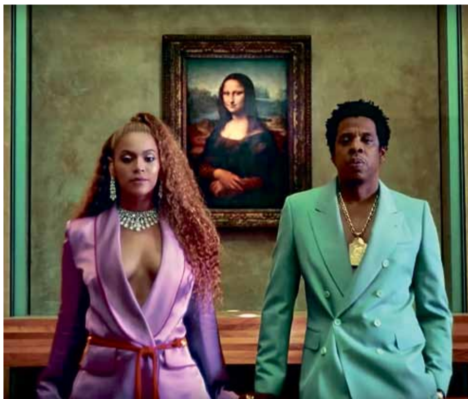
● Η Μπιγιονσέ με τον Jay-Z μπροστά στη «Μόνα Λίζα» στο Λούβρο, όπου γυρίστηκε το βιντεοκλίπ του τραγουδιού «Ape**t».

γόμενο Beyhive, θα περάσει ευχαριστημένη τα επερχόμενα γενέθλιά της (στις 4 Σεπτεμβρίου θα κλείσει τα 38 της χρόνια). Δύο τραγούδια της βρέθηκαν στην καλοκαιρινή playlist που δημοσίευσε ο τέως πρόεδρος των ΗΠΑ Μπαράκ Ομπάμα, πορτρέτο του οποίου επίσης φιλοξενείται σε κάποια από τις αίθουσες του Σμιθσόνιαν (κάποια περίοδο είχαν μάλιστα κυκλοφορήσει ορισμένες φήμες περί ερωτικής τους σχέσης): το «Mood 4 Eva», στο οποίο συμμετέχουν ο σύζυγός της Jay-Z, ο Childish Gambino και η τραγουδίστρια από το Μάλι Ούμου Σανγκάρε, και το «Shining» του Dj Khaled, στο οποίο το ζεύγος Κάρτερ συμμετέχει στα φωνητικά. Το πρώτο μάλιστα προέρχεται από το άλμπουμ «The Lion King: The Gift», μια συλλογή με νέα τραγούδια που λειτουργεί συνοδευτικά στο επίσημο soundtrack του μπλοκμπάστερ «Ο βασιλιάς των λιονταριών» και δημιουργήθηκε υπό την επιμέλεια της πανίσχυρης σουπερ-στάρ. Στο φωτορεαλιστικό εφευριστικό ριμέικ της μεγάλης επιτυχίας των στούντιο της Disney, η Μπιγιονσέ δάνεισε τη φωνή της στη βασίλισσα Νάλα, έναν σχετικά μικρό ρόλο – περί τις 35 ατάκες λείπει σε ολόκληρη την ταινία. Απαντες βεβαίως γνωρίζουν ότι η εμπορική της απήχηση είναι τέτοια που η προώθηση της ταινίας στηρίχτηκε αρκετά στη σύντομη, πλην πολύτιμη, παρουσία της. Οι εισπράξεις του φιλμ, που έχουν ξεπεράσει παγκοσμίως το 1,5 δισεκατομμύριο δολάρια, δικαιώνουν την αξία της εμπλοκής της.