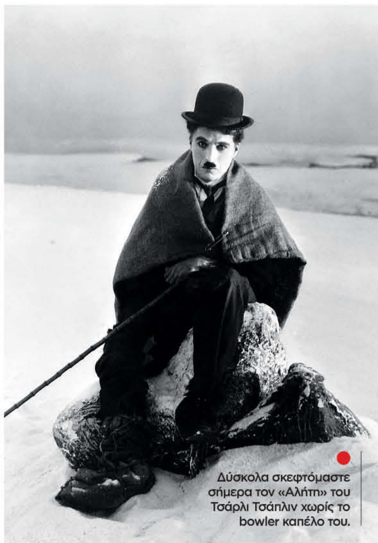
● Δύσκολα σκεφτόμαστε σήμερα τον «Αλήτη» του Τσάρλι Τσάπλιν χωρίς το bowler καπέλο του.

Είναι κυριολεκτικά αδύνατον να φέρουμε στο μυαλό μας τον «Αλή-