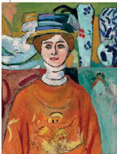
«The Girl with Green Eyes» (1908), του Ανρί Ματίς.