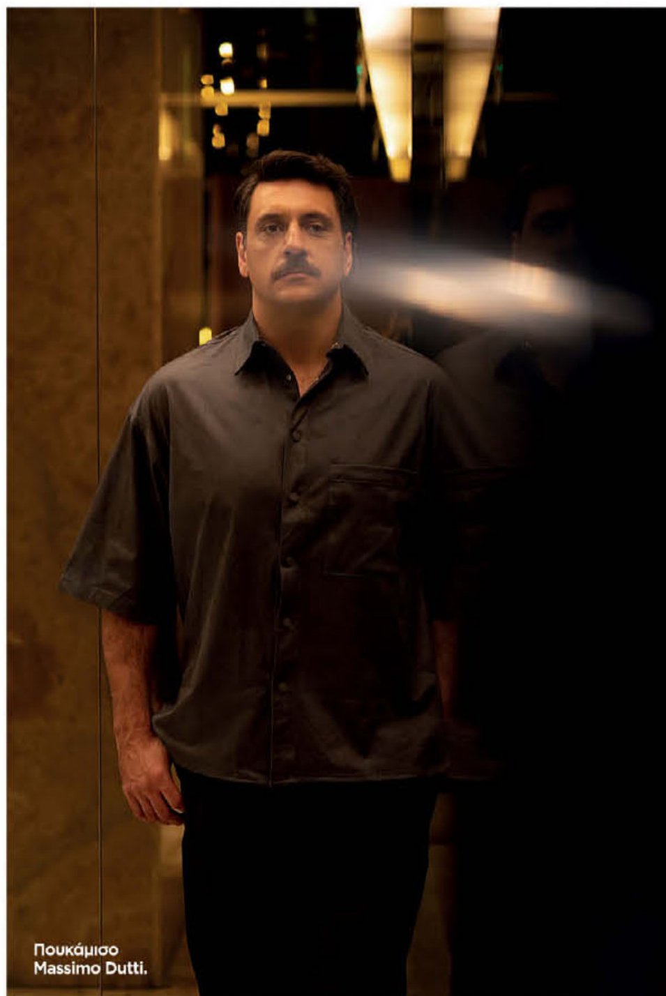
Πουκάμισο Massimo Dutti.

Την τηλεόραση ομολογεί ότι την αγαπά. «Αν και πέρασα πολλά στάδια μαζί της. Βέβαια η τηλεόραση έχει εξελιχθεί, δεν είναι η ίδια με εκείνη που γνώρισα όταν ξεκινούσα. Τότε ήταν πιο έντονη η ενα-