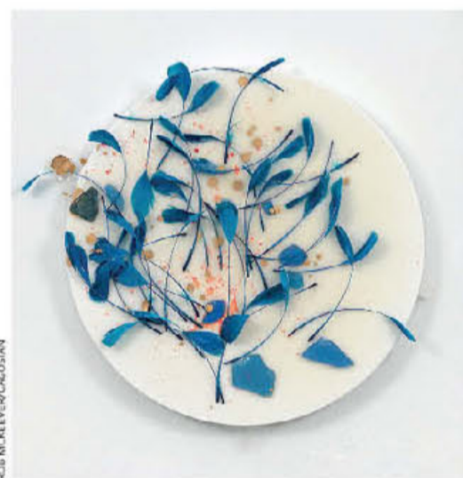
● Ένα από τα πιο πρόσφατα έργα της, το «Sanuk II» (2023).