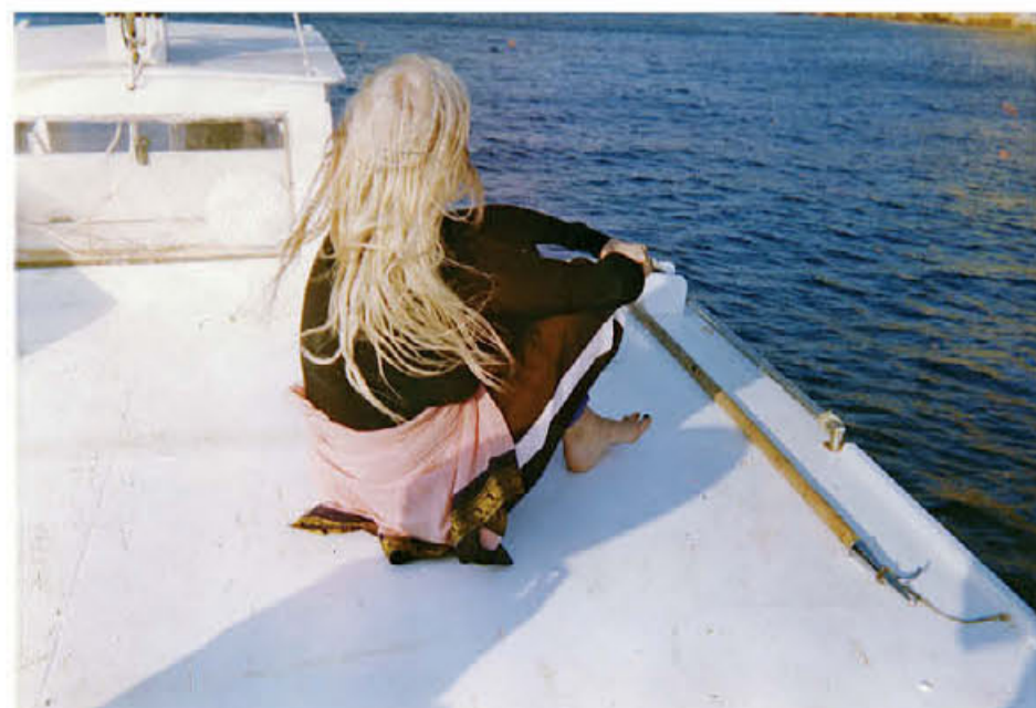
● Στην Υδρα τη δεκαετία του '80.