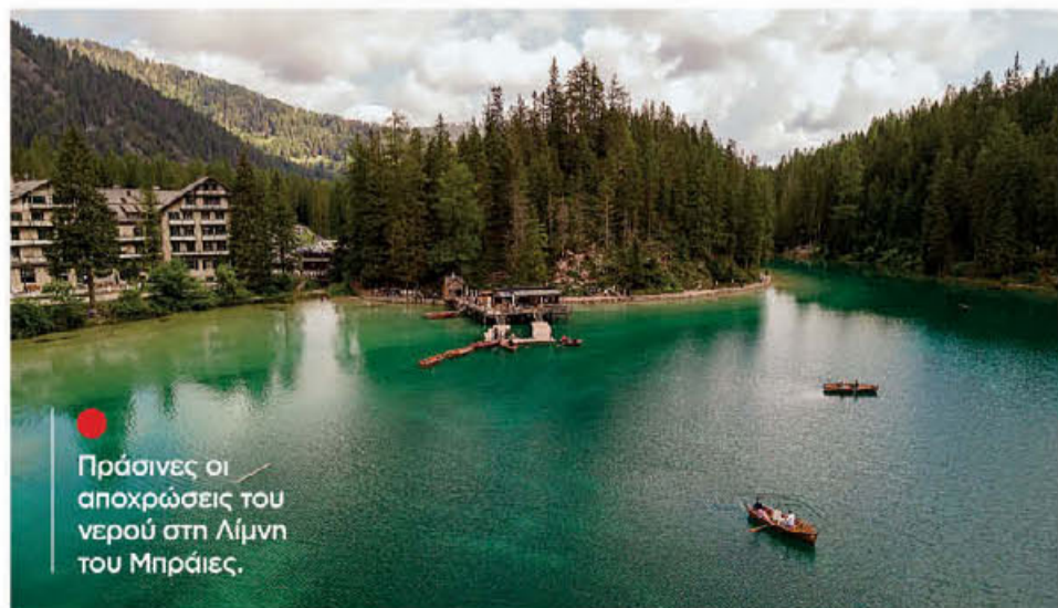
Πράσινες οι αποχρώσεις του νερού στη Λίμνη του Μπράιες.

πέρασμα Staulanza και το Rifugio Nuolau με το παλαιότερο εν λειτουργία καταφύγιο στους Δολομίτες, μια ξύλινη «καλύβα» που χτίστηκε το 1883, είναι μερικές από τις δημοφιλέστερες στάσεις.