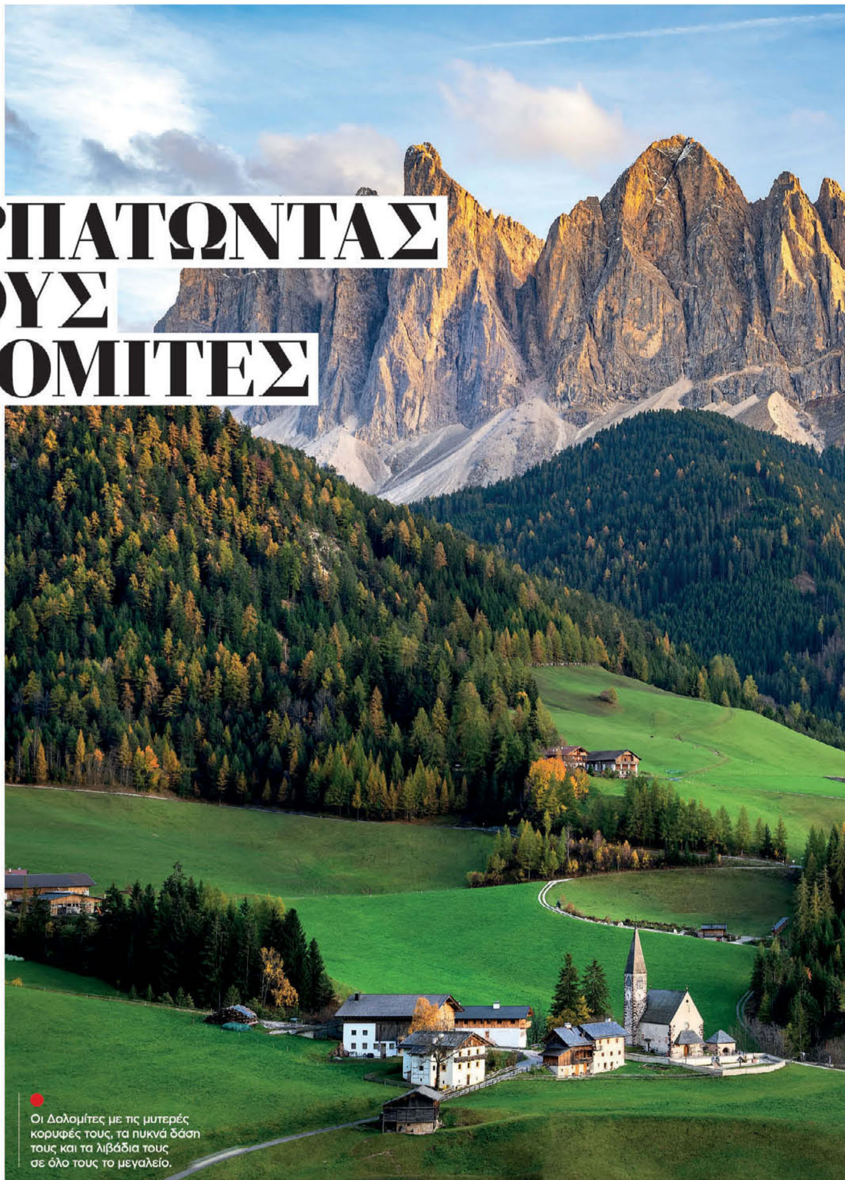
Οι Δολομίτες με τις μυτερές κορυφές τους, τα πυκνά δάση τους και τα λιβάδια τους σε όλο τους το μεγαλείο.

Την περίοδο που οι περισσότεροι βρίσκονται ακόμη στη θάλασσα, εμείς παίρνουμε τα βουνά. Συγκεκριμένα, τα πανέμορφα βουνά της Βόρειας Ιταλίας. Έχουμε λόγο: στη φημισμένη για τα χιονοδρομικά κέντρα της περιοχή – δημοφιλή προορισμό για τους λάτρεις των χειμερινών σπορ αλλά και για τους ισχυρούς του χρήματος, τις διασημότητες και τους εναπομείναντες ευρωπαίους αριστοκράτες – τώρα που έχουν λιώσει τα χιόνια μπορούμε να απολαύσουμε μερικές από τις ομορφότερες πεζοπορίες. Ειδικά το ανατολικό τμήμα των Ιταλικών Άλπεων, οι Δολομίτες, μας προσφέρει χιλιάδες (εύκολα ή και δυσκολότερα) μονοπάτια. Δρόμους χαραγμένους από αιώνες, οι οποίοι διασχίζουν τοπία εξωπραγματικής ομορφιάς, περνάνε ανάμεσα από απόκρημνες βραχώδεις κορυφές που μοιάζουν με καταπράσινα φαράγγια και από πυκνά δάση στα ξέφωτα των οποίων λάμπουν στο φως του ήλιου μικρές πεντακάθαρες λίμνες. Φοράμε κι εμείς ένα ζευγάρι άνετα παπούτσια για πεζοπορία, βάζουμε στο σακιδιό μας τα απαραίτητα, κάτω για το κολατσιό, λίγο νερό, αντηλιακό, εντομοαπωθητικό και καταπραυντικό τζελ για τα τσιμπήματα (γιατί καλά και ωραία τα δάση αλλά έχουν και τους «κινδύνους» τους), και ξεκινάμε. Εννοείται πως αν δεν είμαστε έμπειροι σε τέτοιου είδους πεζοπορίες επιλέ-