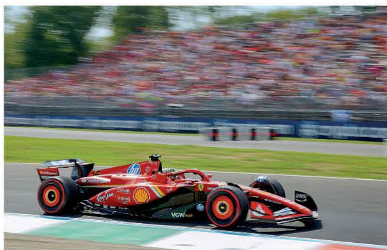
● Ο 26χρονος πιλότος της Formula 1 κατάφερε να βγάλει 53 γύρους με μόλις ένα πιτ στοπ.

στον επιστήθιο φίλο του μεγάλου αδελφού του και μετέπειτα δικό του νονό, Ζιλ Μπιανκί. Η φυσική, πηγαία ικανότητά του πίσω από το τιμόνι ήταν εμφανής από νωρίς και σύντομα άρχισε να κερδίζει πρωταθλήματα. Κατέκτησε τον τίτλο PACA στη Γαλλία το 2005, το 2006 και το 2008, κάνοντας μια πρώτη επί-