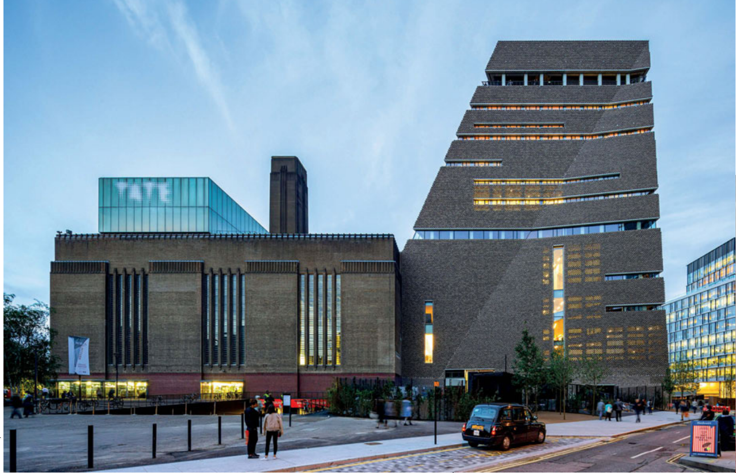
IWAN BAAH/ROYAL ACADEMY OF ARTS

Η Royal Academy of Arts στο Λονδίνο παρουσιάζει μια αναδρομική έκθεση αφιερωμένη στη δουλειά των βραβευμένων με Pritzker ελβετών αρχιτεκτόνων.