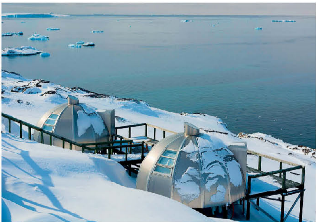
KACS-MULTANER ARCTIC RESORT/LAPLAND, FINLAND

● Τα μεταλλικά ιγκλού του Hotel Arctic στη Γροιλανδία, εκτός από άνοιγμα στον ουρανό χαρίζουν απεριόριστη θέα και στη γεμάτη παγόβουνα θάλασσα.