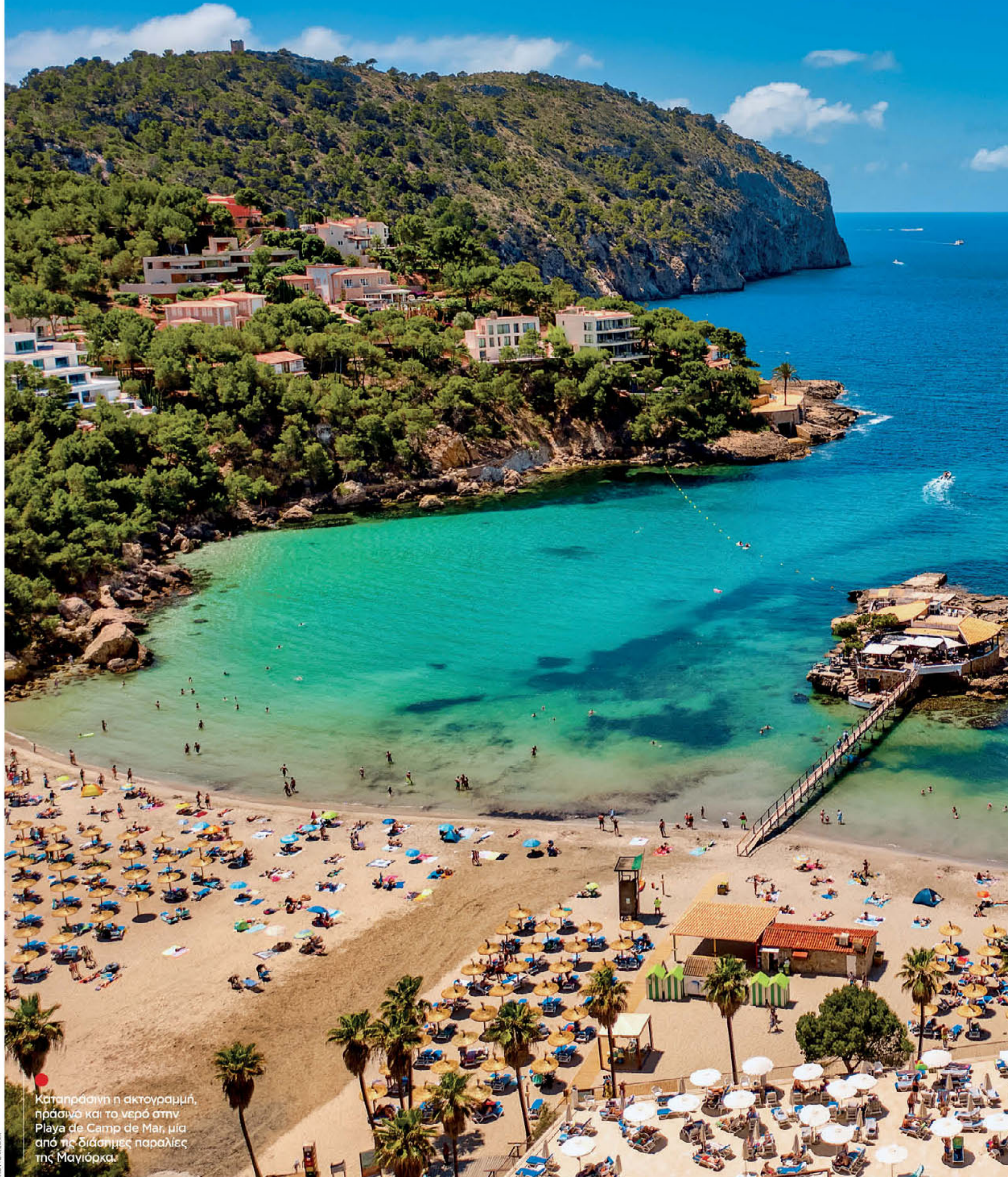
Καταπράσινη η ακτογραμμή, πράσινο και το νερό στην Playa de Camp de Mar, μία από τις διάσημες παραλίες της Μαγιόρκα.