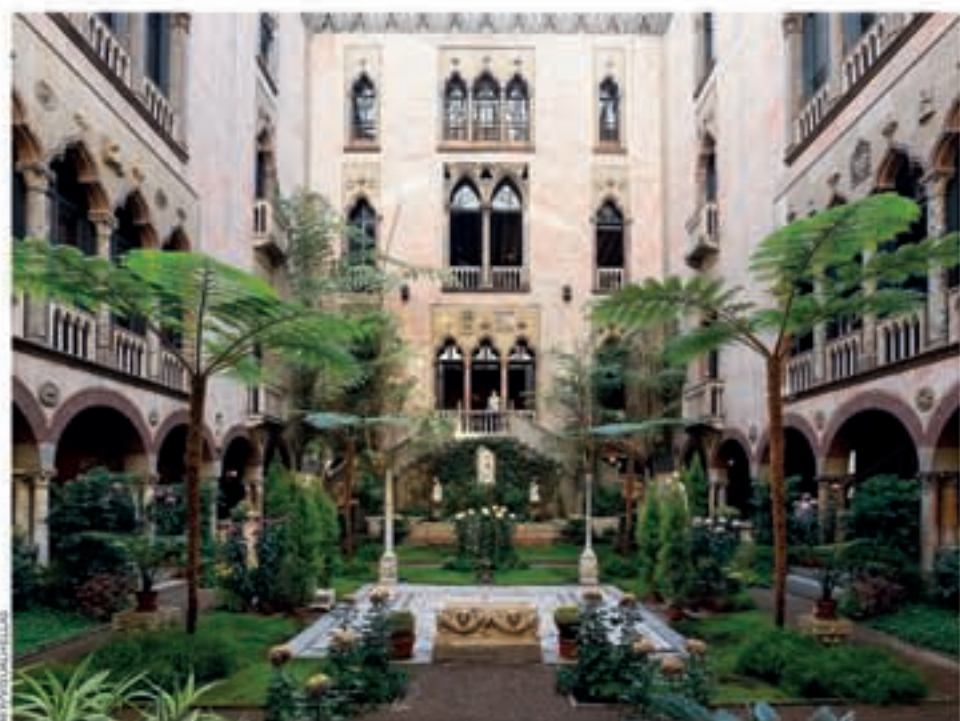
Αριστερά: Το αίθριο του Μουσείου, το οποίο χτίστηκε για να θυμίζει βενετσιάνικο palazzo. Κάτω: Οι αίθουσες με τις κενές κορνίζες που περιμένουν τα κλεμμένα έργα να επιστρέψουν.