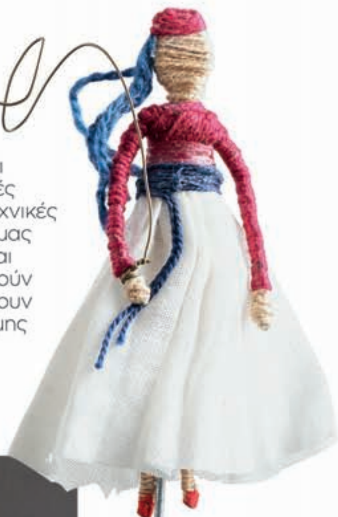
● Διακοσμητικό γραφείου.