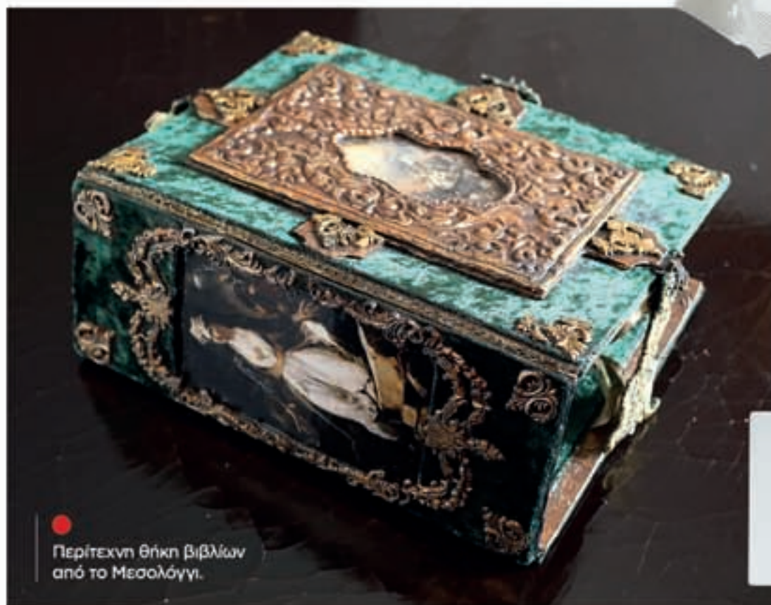
● Περίτεχνη θήκη βιβλίων από το Μεσολόγγι.