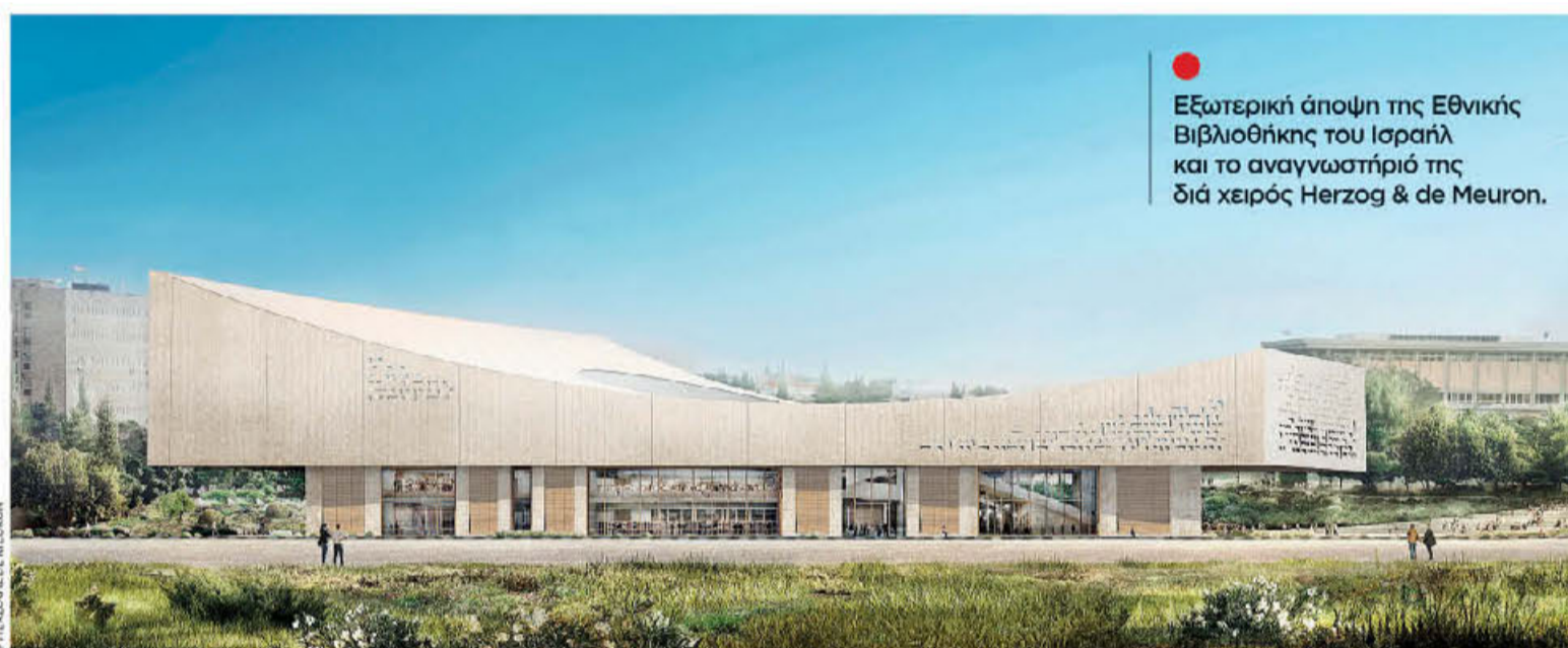
Εξωτερική άποψη της Εθνικής Βιβλιοθήκης του Ισραήλ και το αναγνωστήριό της διά χειρός Herzog & de Meuron.

Νέα εντυπωσιακά κτίρια και φιλόδοξα projects οικιστικής ανάπτυξης ετοιμάζονται να κάνουν αισθητή την παρουσία τους ανά τον κόσμο.