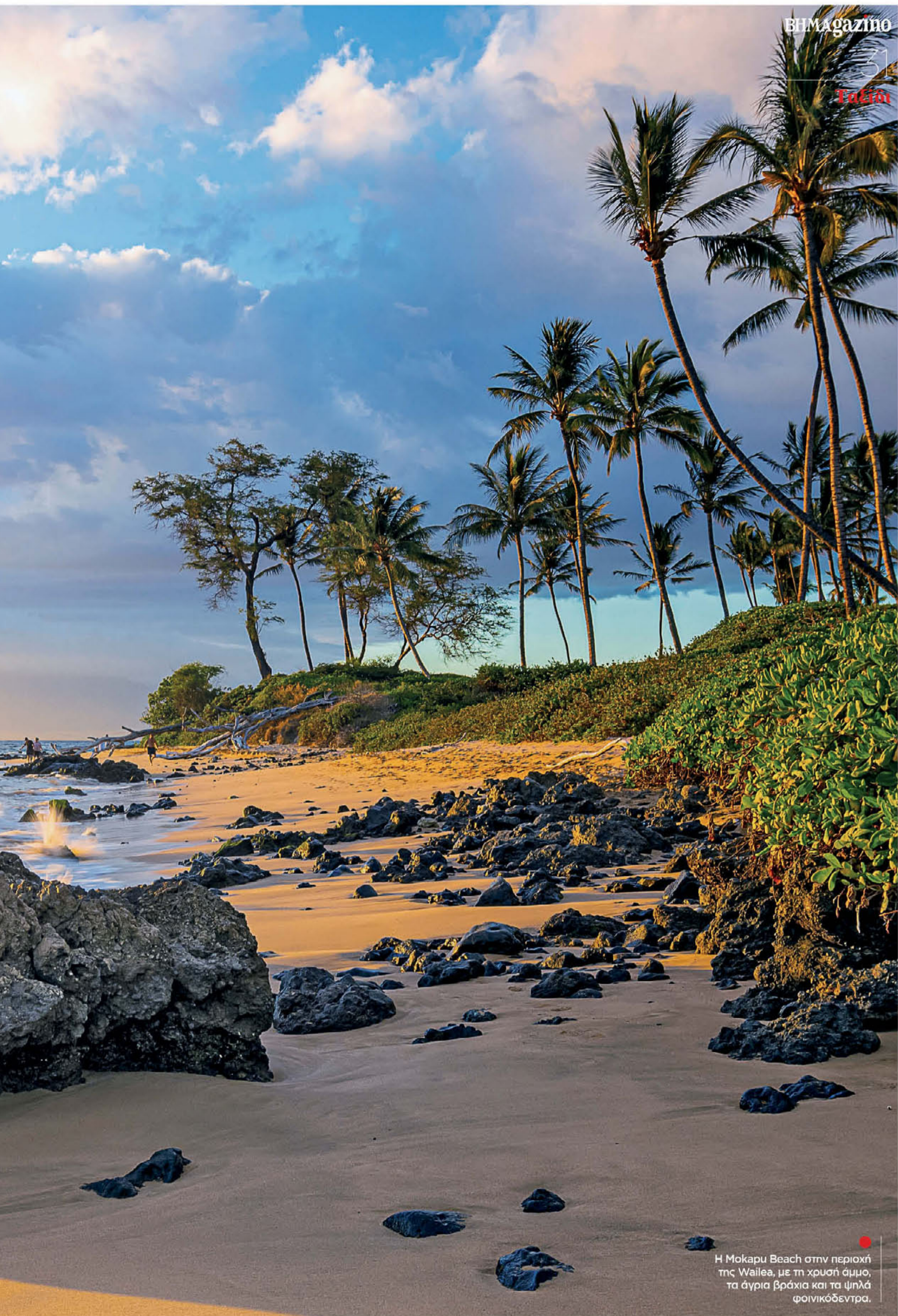
Η Mokapu Beach στην περιοχή της Wailea, με τη χρυσή άμμο, τα άγρια βράχια και τα ψηλά φοινικόδεντρα.