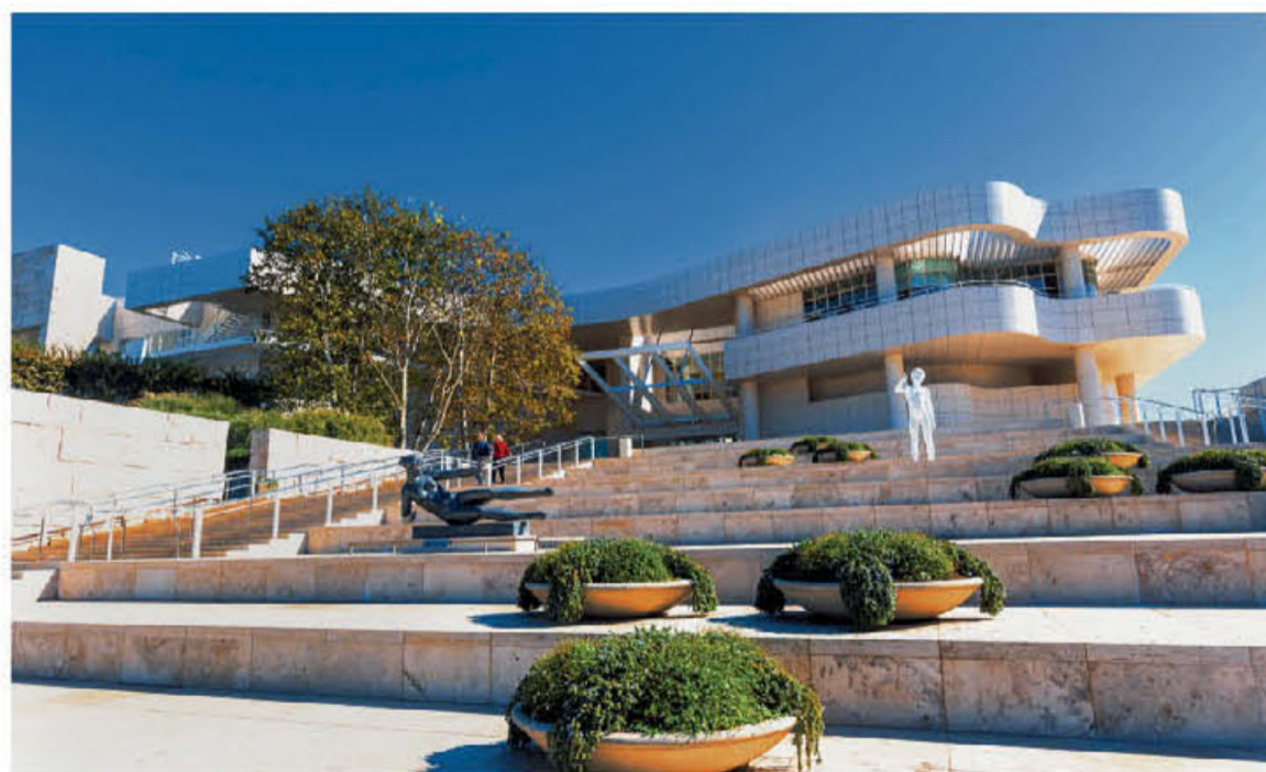
● Το Getty Center, σχεδιασμένο από τον Ρίτσαρντ Μάιερ, διαθέτει μια τεράστια συλλογή έργων τέχνης.

νεί το Αστροσκοπείο Γκρίφιθ, και εξηγούν: «Ορισμένες περιόδους του χρόνου περνούν από τις γειτονιές μας εκατομμύρια μεταναστευτικά πουλιά, πλάσματα που η φωτορύπανση τα κάνει να χάσουν τον προσανατολισμό τους και τα βγάζει από τον δρόμο τους. Γι' αυτό, μεταξύ 15 Αυγούστου και 30 Νοεμβρίου χαρίστε στα πουλιά ένα διάλειμμα νύχτας και χαμηλώστε ή, αν γίνεται, σβήστε τα φώτα σας». Συγκινητικό το ενδιαφέρον και αξιέπαινη η προσπάθειά τους να διευκολύνουν τη ροή της φύσης σε μια εποχή που το μόνο που κάνουμε είναι να την