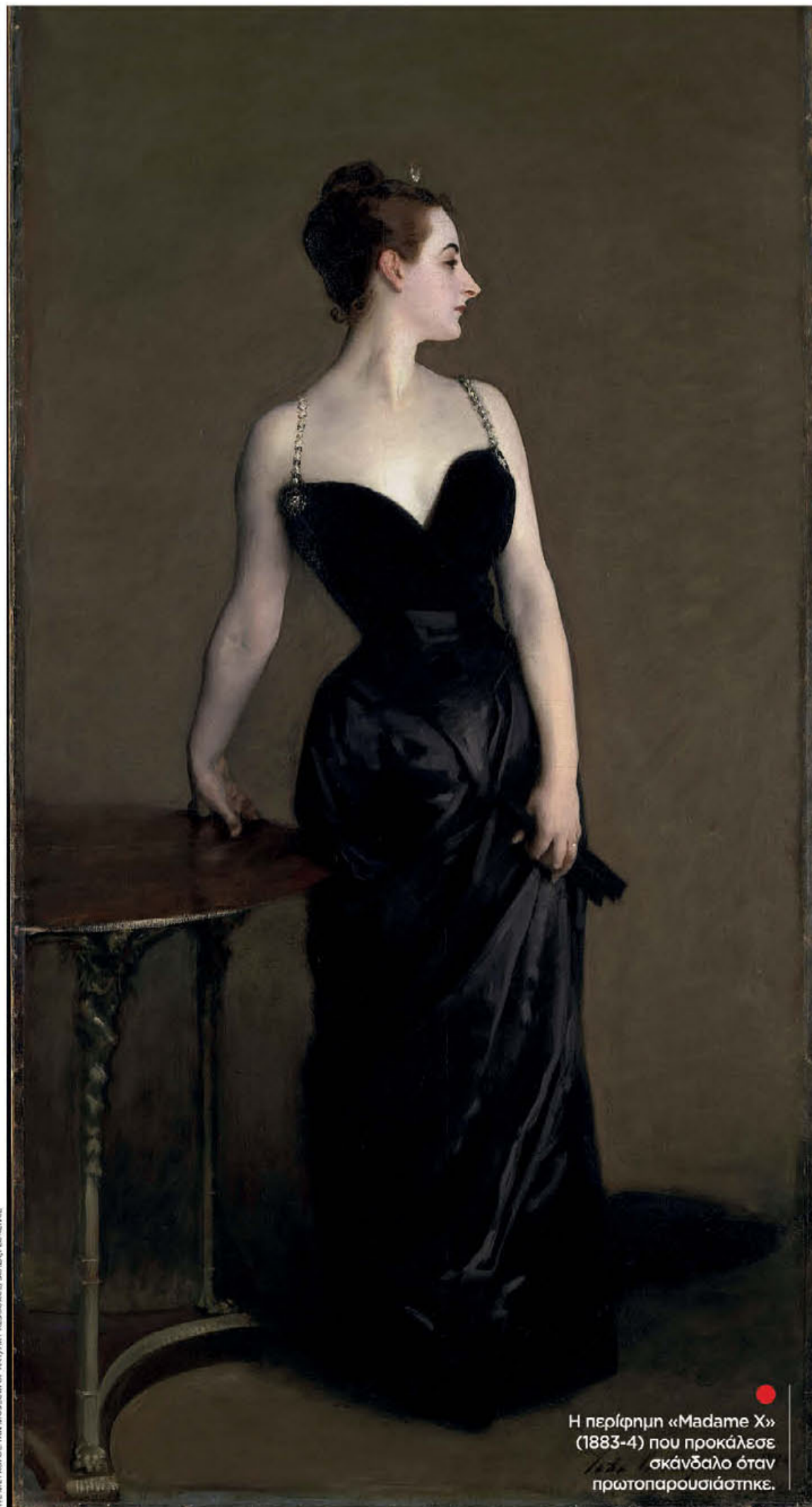
Η περίφημη «Madame X» (1883-4) που προκάλεσε σκάνδαλο όταν πρωτοπαρουσιάστηκε.

Δύο μεγάλες εκθέσεις σε Βοστώνη και Λονδίνο μαρτυρούν ότι ο αμερικανός πορτραίστας γνώριζε πολύ καλά πώς οι ενδυματολογικές επιλογές λένε για τους ανθρώπους όσα θέλουν αλλά και όσα δεν επιθυμούν να αποκαλύψουν στους άλλους.