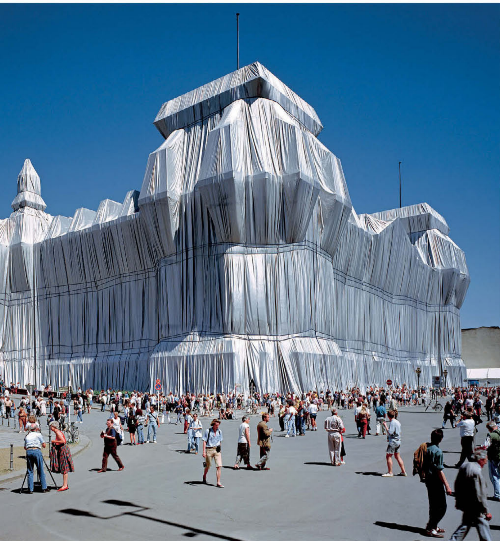
● Το «αμπαλαρισμένο» Ράιχσταγκ το 1995, διά χειρός Christo και Jeanne-Claude. Η αναδρομική του έργου τους ξεκινά στις 15 Νοεμβρίου στη Saatchi Gallery.