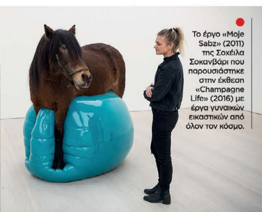
● Το έργο «Moje Sabz» (2011) της Σοχέιλα Σοκανβάρι που παρουσιάστηκε στην έκθεση «Champagne Life» (2016) με έργα γυναικών εικαστικών από όλον τον κόσμο.