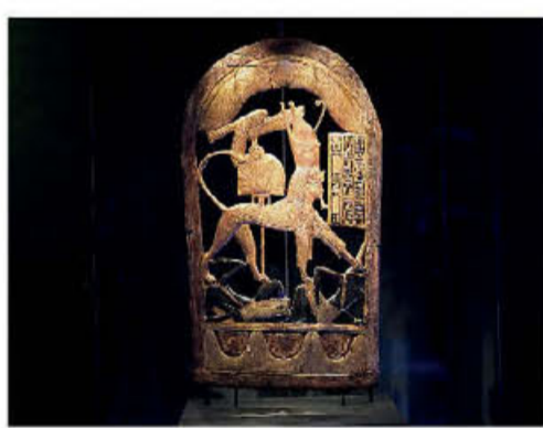
● Επάνω: Σχετικά πρόσφατα στην Gallery Saatchi έδωσε το «παρών» και η έκθεση «Τουταγχαμών: Οι θησαυροί του χρυσού Φαραώ» (2019-2020). Κάτω: Το περιβόητο κρεβάτι «My Bed» (1998) της Τρέισι Εμιν, το οποίο για μια περίοδο ήταν εγκατεστημένο σε ειδικό χώρο στο σπίτι του Τσαρλς Σάατσι.