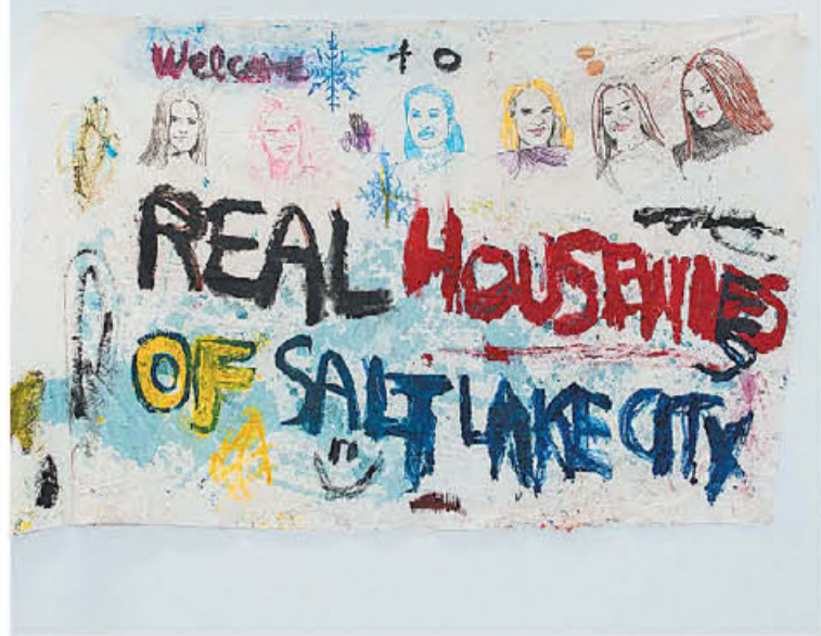
● Τζέιμς Φράνκο, «Real Housewives of Salt Lake City» (2024, © the artist, courtesy The Breeder, Athens).