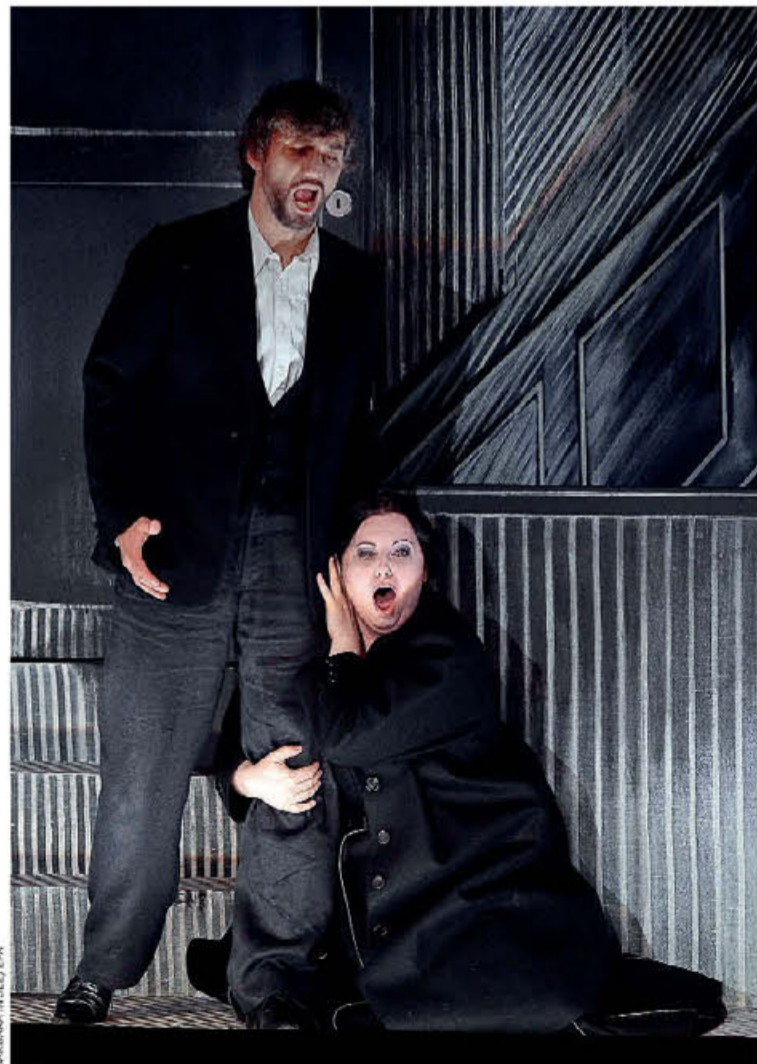
● Ο Γιόνας Κάουφμαν και η Λιουντμίλα Μοναστίρσκα στην «Καβαλερία Ρουσικάνια» του Μασκάνι (Σάλτσμπουργκ, 2015).

«Μου αρέσει να εργάζομαι πολύ και δεν σκοπεύω να εγκαταλείψω σε καμία περίπτωση άμεσα το τραγούδι, οπότε τώρα έχω