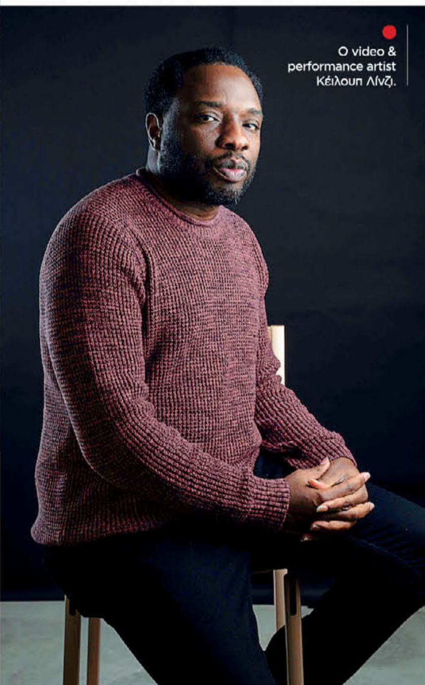
● Ο video & performance artist Κέιλουμ Λίντζι.