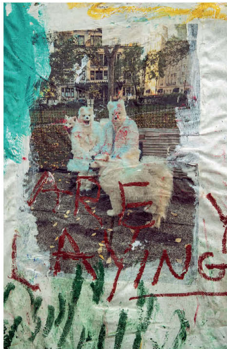
● Λεπτομέρεια του έργου του Τζέιμς Φράνκο «Vanderpump» (2025, © the artist, courtesy The Breeder, Athens).

συναντιούνταν κάπου στη μέση, δημιουργώντας έναν δημιουργικό διάλογο που ήταν πραγματικά ξεχωριστός» θα πει ο Φράνκο. Σε αυτή τη διάλεξη, ο Λίντζι είχε εκφράσει μεγαλόφωνα τη διαχρονική του επιθυμία να παίξει σε μια κανονική, mainstream σαπουνόπερα και όχι μόνο σε εκείνες που ενορχηστρώνει ο ίδιος. Αλλωστε, η δημιουργική του πορεία είχε προκύψει λίγο από ανάγκη, διά της εις άτοπον απαγωγής. Ένας μαύρος, queer, με προφορά από τον αμερικανικό Νότο καθότι γεννημένος και μεγαλωμένος στην Πολιτεία της Φλόριντα, δεν είχε ελπίδες να βρει μια θέση στις ως επί το πλείστον φυλετικά «καθαρές» σαπουνόπερες, κι ας ήταν ένας διαχρονικός τηλεθεατής τους. «Μεγάλωσα με σαπουνόπερες, μια παράδοση που ξεκίνησε από την προγιαγιά μου, η οποία άκουγε το “Guiding Light” στο ραδιόφωνο τη δεκαετία του 1930. Η αγάπη αυτή πέρασε στη γιαγιά μου, η