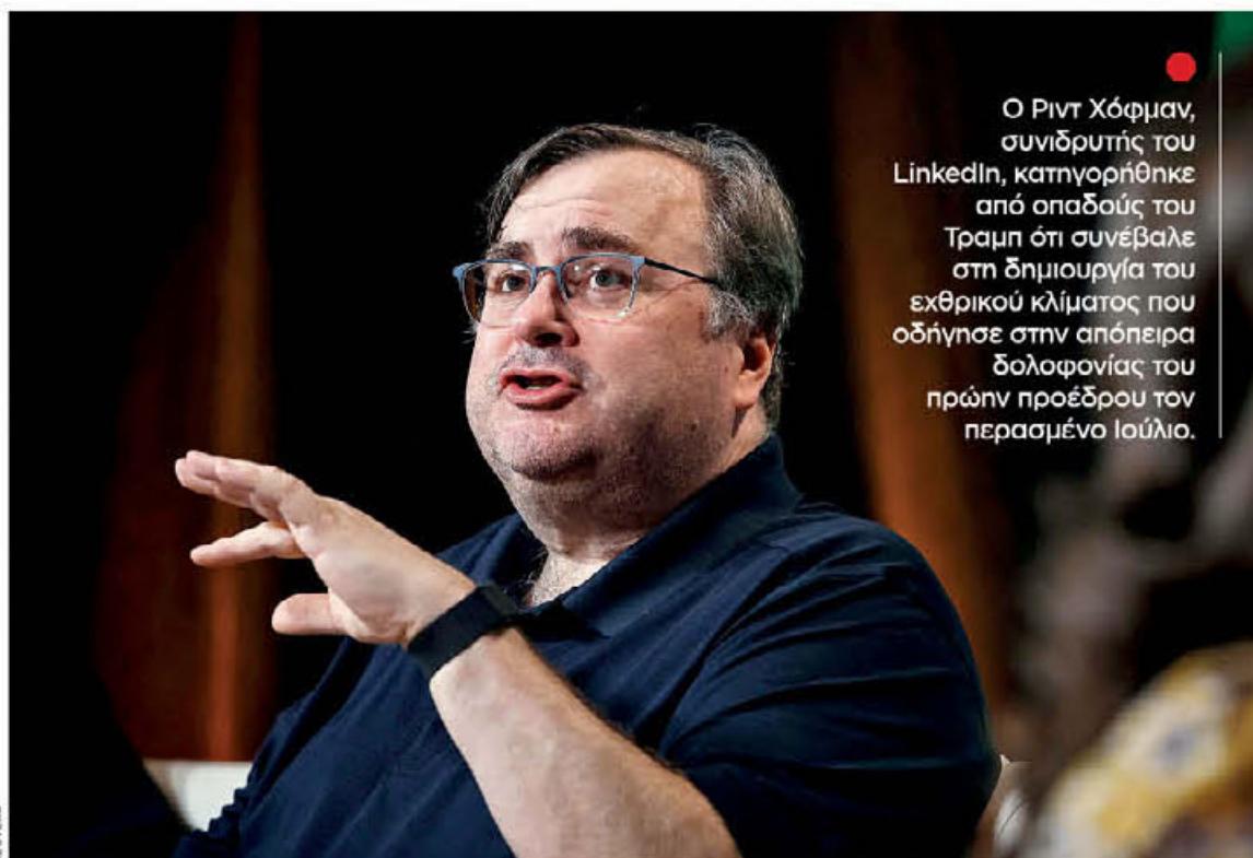
Ο Ριντ Χόφμαν, συνιδρυτής του LinkedIn, κατηγορήθηκε από οπαδούς του Τραμπ ότι συνέβαλε στη δημιουργία του εχθρικού κλίματος που οδήγησε στην απόπειρα δολοφονίας του πρώην προέδρου τον περασμένο Ιούλιο.

Γιατί διακεκριμένοι εκπρόσωποι της τεχνολογικής κοινότητας προχωρούν τις τελευταίες εβδομάδες σε πρωτοφανείς δημόσιους διαπληκτισμούς με αφορμή τη μονομαχία μεταξύ Τραμπ και Χάρις για την αμερικανική προεδρία.