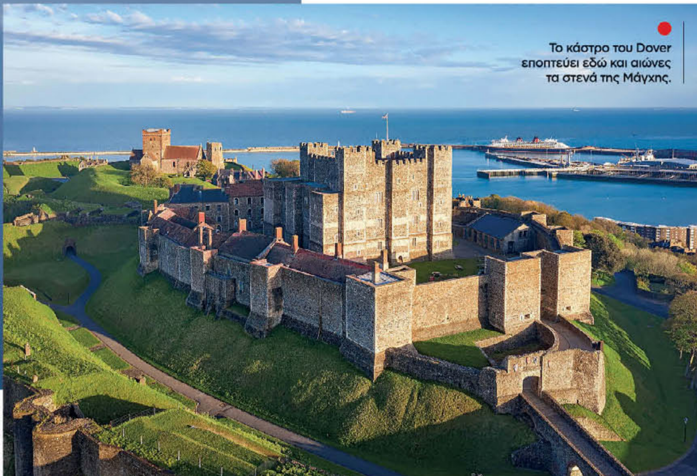
Το κάστρο του Dover εποπτεύει εδώ και αιώνες τα στενά της Μάγχης.

Χτισμένο στο στενότερο σημείο της Μάγχης, απέναντι από το γαλλικό Καλέ, το Ντόβερ λόγω της θέσης του ήταν από αρχαιοτάτων χρόνων πόλη ιδιαίτερης στρατηγικής σημασίας. Σήμερα είναι διάσημο κυρίως για τους λευκούς βράχους του, ένα εμβληματικό φυσικό αξιοθέατο του Ηνωμένου Βασιλείου, αλλά και για το κάστρο που κατασκεύασε εκεί τον 11ο αιώνα ο Γουλιέλμος ο Κατακτητής. Και που λόγω της τοποθεσίας του θεωρήθηκε «το κλειδί της Αγγλίας». Βρίσκεται στην κορυφή ενός λόφου με ανεμπόδιση θέα στη θάλασσα και λειτουργεί, βεβαίως, ως μουσείο. Ένα μουσείο που αφορά και τη σχετικά πρόσφατη ιστορία, καθώς το Κάστρο του Ντόβερ χρησιμοποιήθηκε για αμυντικούς σκοπούς και στον Α' και στον Β' Παγκόσμιο Πόλεμο.