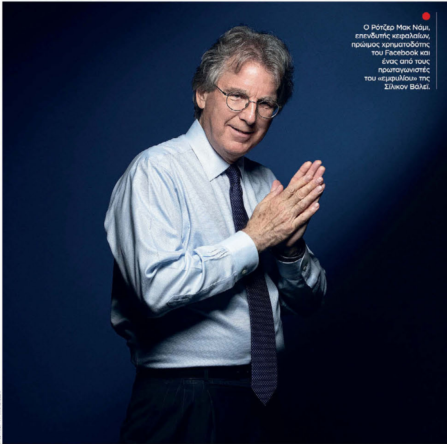
Ο Ρότζερ Μακ Νάμι, επενδυτής κεφαλαίων, πρώιμος χρηματοδότης του Facebook και ένας από τους πρωταγωνιστές του «εμφυλίου» της Σίλικον Βάλει.

Στο μυαλό της αμερικανικής κοινής γνώμης, συντηρητικής και μη, η «Κοιλιάδα του πυριτίου» ταυτίζεται με έναν γεωγραφικό σχηματισμό γεμάτο ακραίες υποστηρικτές των Δημοκρατικών. Βρίσκεται στην Καλιφόρνια, είναι μέρος της Bay Area, γειτνιάζει με το Σαν Φρανσίσκο – όλα προπύργια των προοδευτικών. Σύμφωνα με μια μελέτη του Πανεπιστημίου Στάνφορντ από το 2017, η ηγεσία της βιομηχανίας της Σίλικον Βάλει τάσσεται με τις liberal απόψεις στα ζητήματα της αναδιανομής του πλούτου, των αμβλώσεων, των δικαιωμάτων της ΛΟΑΤΚΙ κοινότητας, της μετανάστευσης. Τα παραπάνω εξακολουθούν να ισχύουν, η ηγετική ομάδα της Σίλικον Βάλει δεν είναι όμως πια μονολιθική – αν υπήρξε ποτέ. Στις 16 Ιουλίου 2024 ο Ντέιβιντ Σακς, πρώην υπ' αριθμόν 2 της PayPal, ανέβαινε στο βήμα του Εθνικού Συνεδρίου των Ρεπουμπλικανών για να δηλώσει καταχειροκροτούμενος την αμέριστη στήριξή του στον Ντόναλντ Τραμπ. Είχε προηγηθεί τρεις μέρες νωρίτερα η δημόσια καταγγελία του στην πλατφόρμα X, αμέσως μετά την απόπειρα δολοφονίας του Τραμπ στο Μπάιτλερ της Πενσιλβάνια, ότι η Αριστερά ήταν περίπου ο ηθικός αυτουργός της. Τη συνόδευε με έναν υπαινιγμό ότι πράξεις όπως