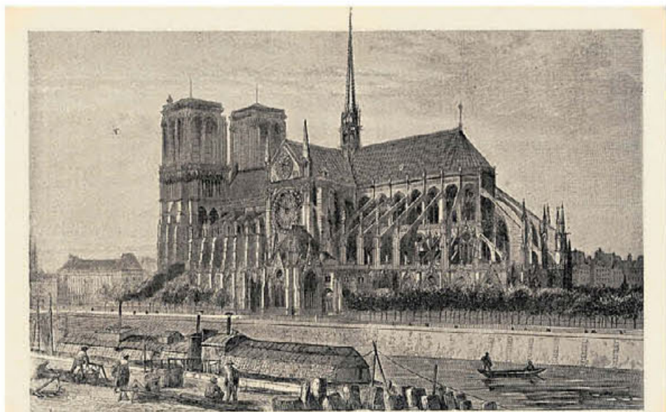
Notre-Dame de Paris et le Quai de l'Archevêché en 1862

Κάτω: Καρτ ποστάλ με την Παναγία των Παρισίων και τις όχθες του Σηκουάνα το 1862.