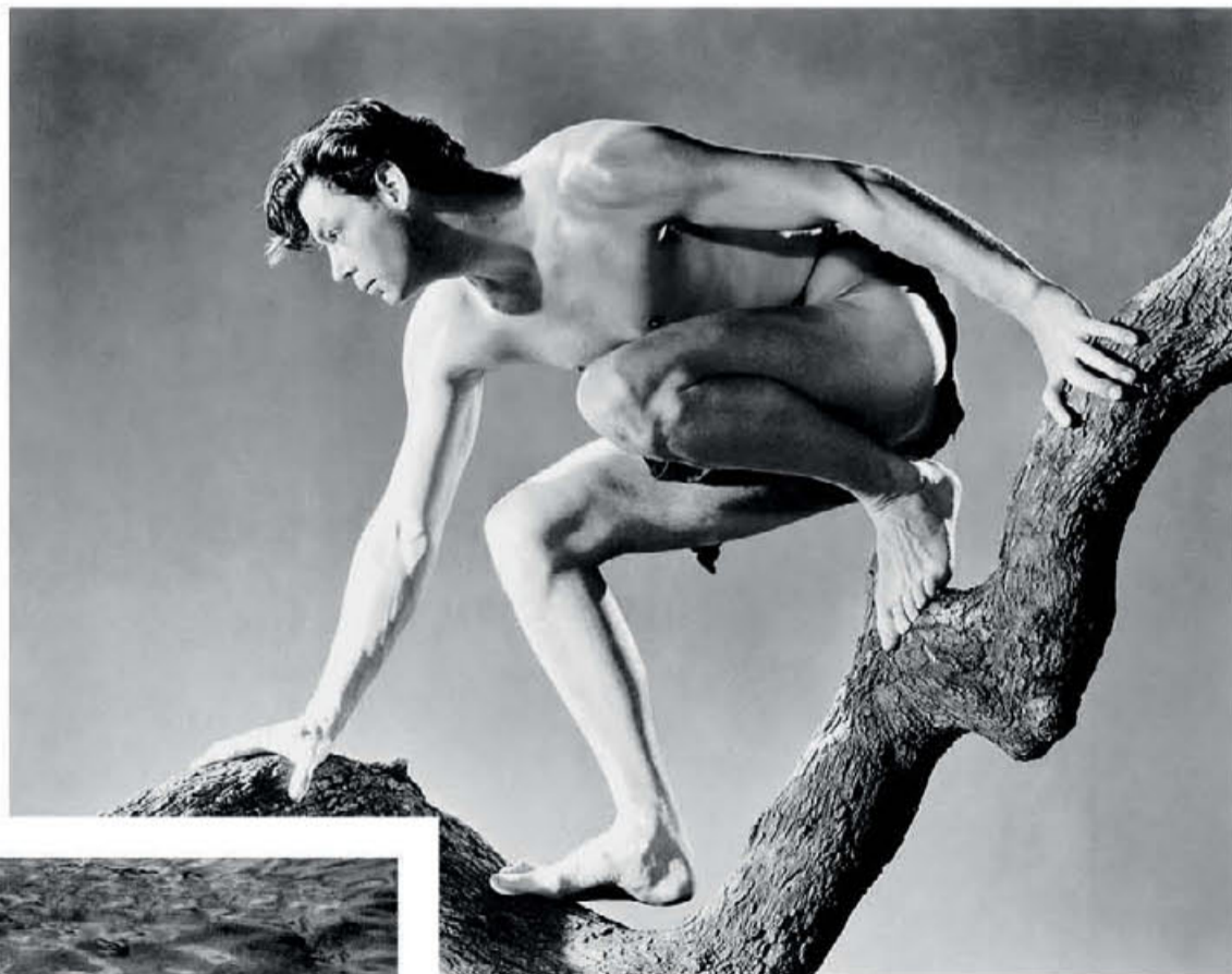
● Ο Τζόνι Βαΐσμυλερ, που παραμένει ο πιο χαρακτηριστικός Ταρζάν του κινηματογράφου (δεξιά), υπήρξε ολυμπιονίκης στην κολύμβηση (κάτω), αποσπώντας συνολικά έξι ολυμπιακά μετάλλια σε δύο διοργανώσεις, πέντε εκ των οποίων ήταν χρυσά.

του εχθρού. Οχι ακριβώς αυτό που λέμε ρόλοι αξιώσεων, παρ' όλα αυτά... Τα χνάρια του Μάικλ Τζόρνταν και του Σακίλ Ο' Νιλ ακολούθησε και ο Λεμπρόν Τζέιμς (χρυσός ολυμπιονίκης σε Πεκίνο 2008 και Λονδίνο 2012), που επίσης άρχισε να ασχολείται με την υποκριτική, κάνοντας μικρά περάσματα κυρίως ως... ο εαυτός του. Πέρα από το «Διαστημικά καλάθια 2: Η νέα γενιά» (Space Jam: A New Legacy, 2021), ξεχωριστή ερμηνεία του Τζέιμς σε ρόλο είναι εκείνη στη δραματική κομεντί «Κατακούπελα» (Trainwreck, 2015), όπου ο σαρ των παρκέ υποδύθηκε τον γλυκομίλητο καλύτερο φίλο ενός αθλητιάτρου (Μπιλ Χέιντερ). Σε γενικές γραμμές, πάντως, οι επιδόσεις του «King James» μπροστά από τις