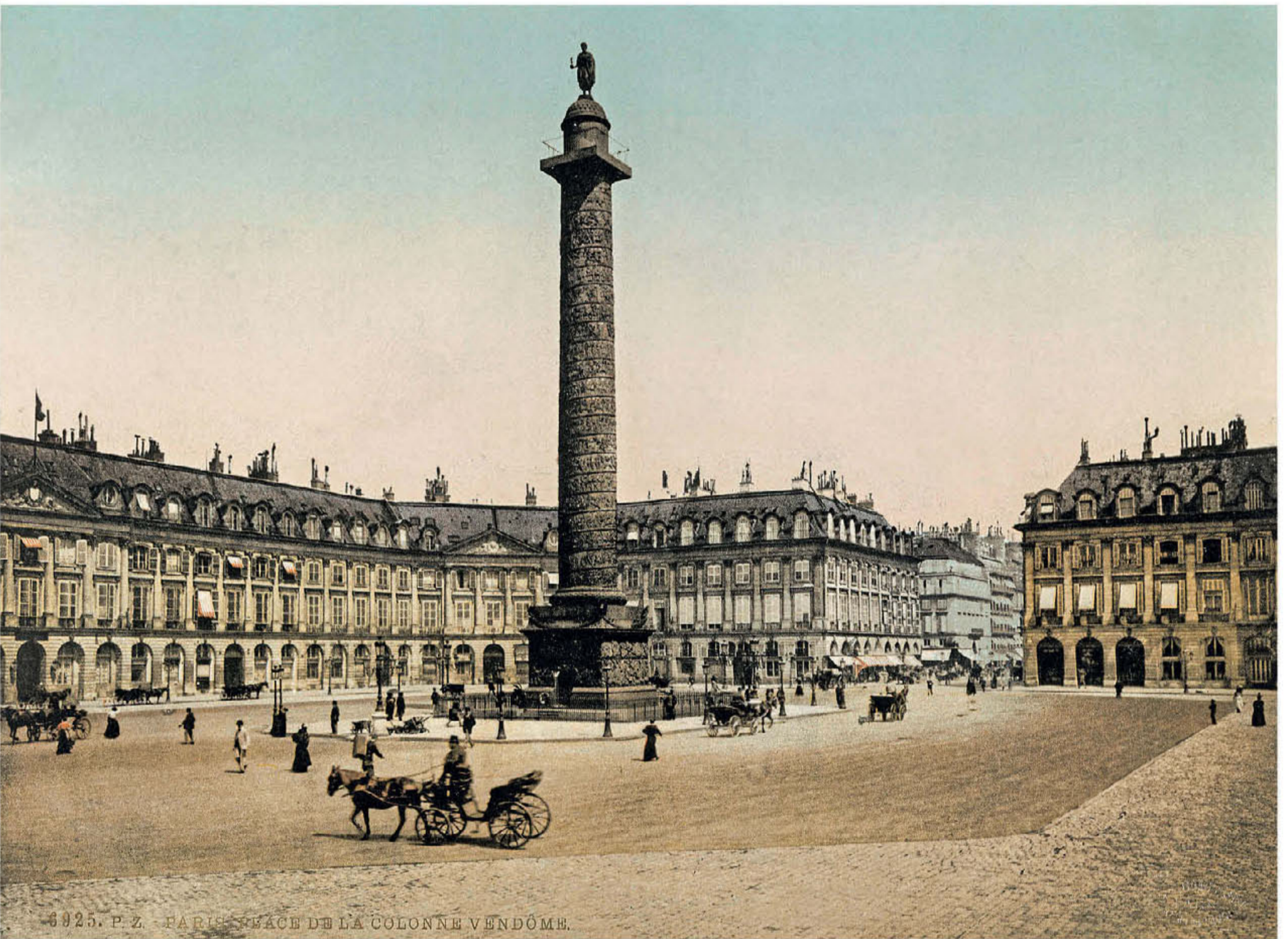
1925. P. Z. - PARIS, PLACE DE LA COLONNE VENDÔME.