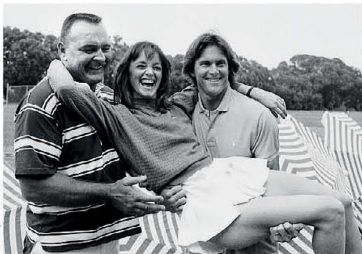
● Νικ Μπούτκουκς, Πάμελα Σου Μάρτιν και Μπρους Τζέιμς (νυν Κέιπλιν Τζέιμς, δεξιά), σε φωτογραφία του 1985, σχεδόν μία δεκαετία από το χρυσό μετάλλιο στο δέκαθλο στους Ολυμπιακούς Αγώνες του Μόντρεαλ.

Αποφασισμένοι να γευθούν μια άλλου είδους επιτυχία, διάσημοι αθλητές των Ολυμπιακών Αγώνων δοκίμασαν τις δυνάμεις τους μπροστά στην κάμερα, ως ηθοποιοί.