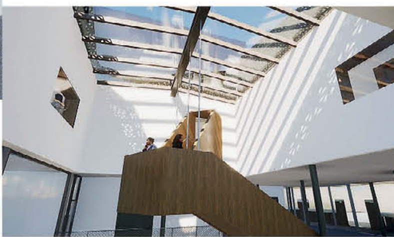
© RENNER HANKE WIRTH, ZIN ARCHITECTEN & WZARCHITECTEN

Επάνω: Το νέο σπίτι του Εθνικού Μουσείου Φωτογραφίας της Ολλανδίας στο Ρότερνταμ είναι το πλήρως ανακαινισμένο ιστορικό κτίριο Santos, το οποίο άνοιξε τις πύλες του για πρώτη φορά το 1903 ως αποθήκη για βραζιλιάνικο καφέ.