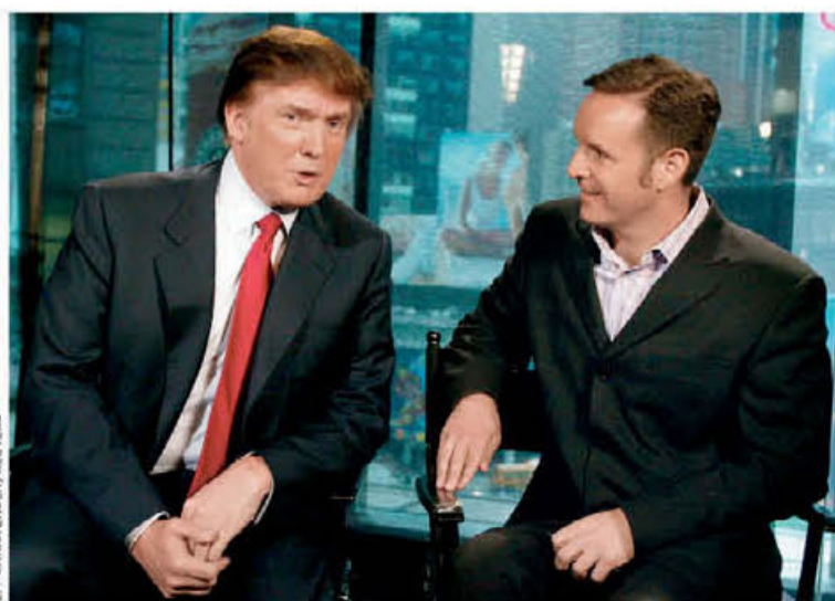
Ο παραγωγός του «The Apprentice», Μαρκ Μπαρνέτ, και ο Ντόναλντ Τραμπ σε συνέντευξη Τύπου το 2003 για το τότε πολυαναμενόμενο ριάλιτι.

Όταν τη δεκαετία του '80 ο Ρόναλντ Ρίγκαν διακήρυττε ότι ξημέρωνε στην Αμερική, ο Γκρόντον Γκέκο της «Wall Street» ότι η απληστία ήταν καλή και οι young upper class professionals (θυμάστε τους «γιάπηδες») προβάλλονταν σε περιοδικά, ταινίες, σειρές ως οι δημιουργοί του μέλλοντος, ο Τραμπ βρισκόταν στο στοιχείο του. Αρκούσε η προσωπική του εγγύηση για να δανειστεί 900 εκατ. δολάρια χάρη στα οποία προέβη σε ένα σαφάρι εξαγορών: το Plaza Hotel στη Νέα Υόρκη, η αεροπορική εταιρεία Eastern Lines Air Shuttle, τρία ξενοδοχεία-καζίνο στο Ατλάντικ Σίτι. Ως το καλοκαίρι του 1990 όλες οι επενδύσεις είχαν αποδειχθεί ζημιωγόνες. Άλλες από αυτές πουλήθηκαν, άλλες χρεοκόπησαν. Ο ίδιος απέφυγε το στίγμα της