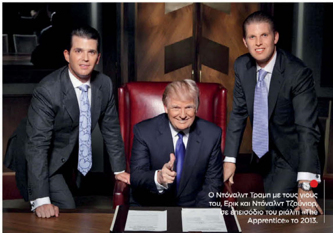
Ο Ντόναλντ Τραμπ με τους γιους του, Ερικ και Ντόναλντ Τζούνιορ, σε επεισόδιο του ριάλιτι «The Apprentice» το 2013.

Είκοσι χρόνια πριν, στις αρχές του 2004, το ριάλιτι σόου «The Apprentice» θα επισκεύαζε τη φθαρμένη δημόσια εικόνα του Ντόναλντ Τραμπ, ανοίγοντάς του τον δρόμο για τη μετέπειτα πολιτική του καριέρα.