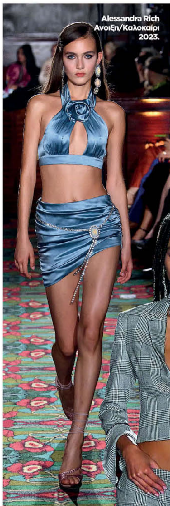
Alessandra Rich Ανοιξη/Καλοκαίρι 2023.