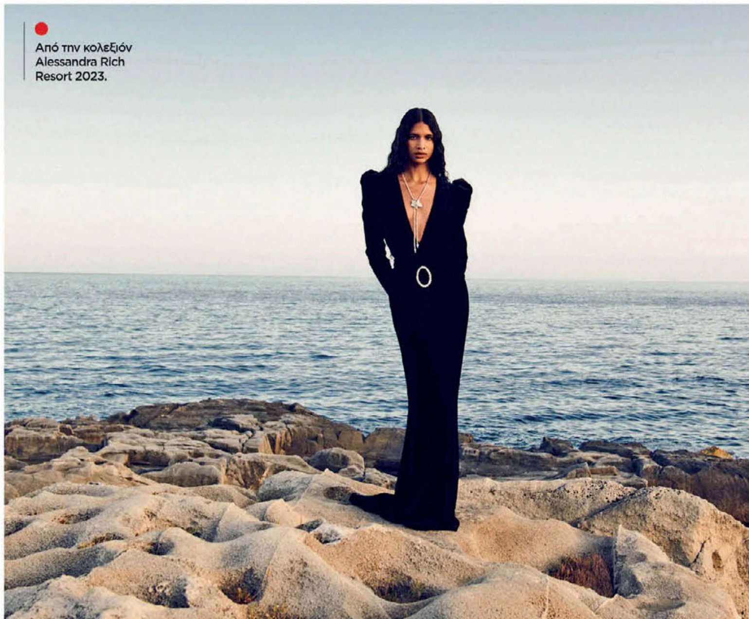
Από την κολεξιόν Alessandra Rich Resort 2023.

Επειτα από μια κολεξιόν πολύ διαφορετική από αυτές που συνηθίζει να παρουσιάζει στο κοινό της, η αγαπημένη σχεδιάστρια της Κέιτ Μίντλετον επέστρεψε στα κλασικά, κομψά, prerpy φορέματα με τα οποία έγινε γνωστή στον κόσμο της μόδας.