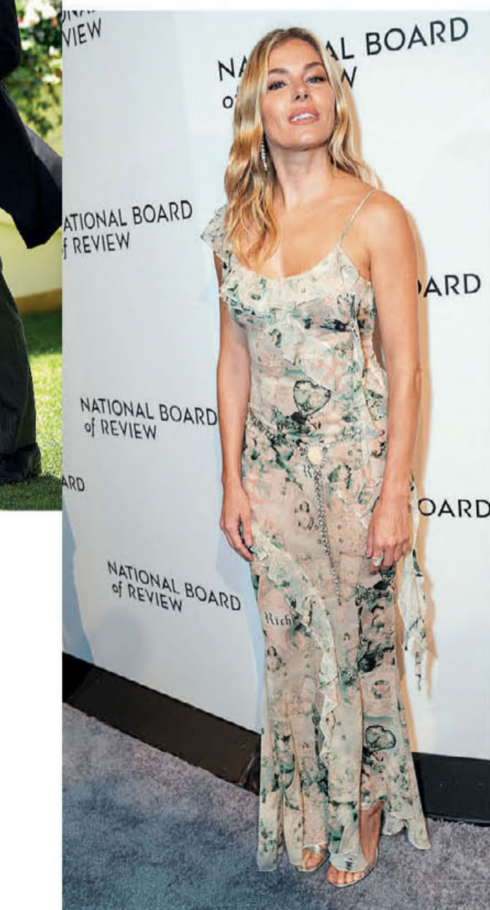
NATIONAL BOARD of REVIEW

● Η Κέιτ Μίντλετον, με φόρεμα Alessandra Rich, φωτογραφίζεται με τον πρίγκιπα Γουίλιαμ στο Royal Ascot το 2022.