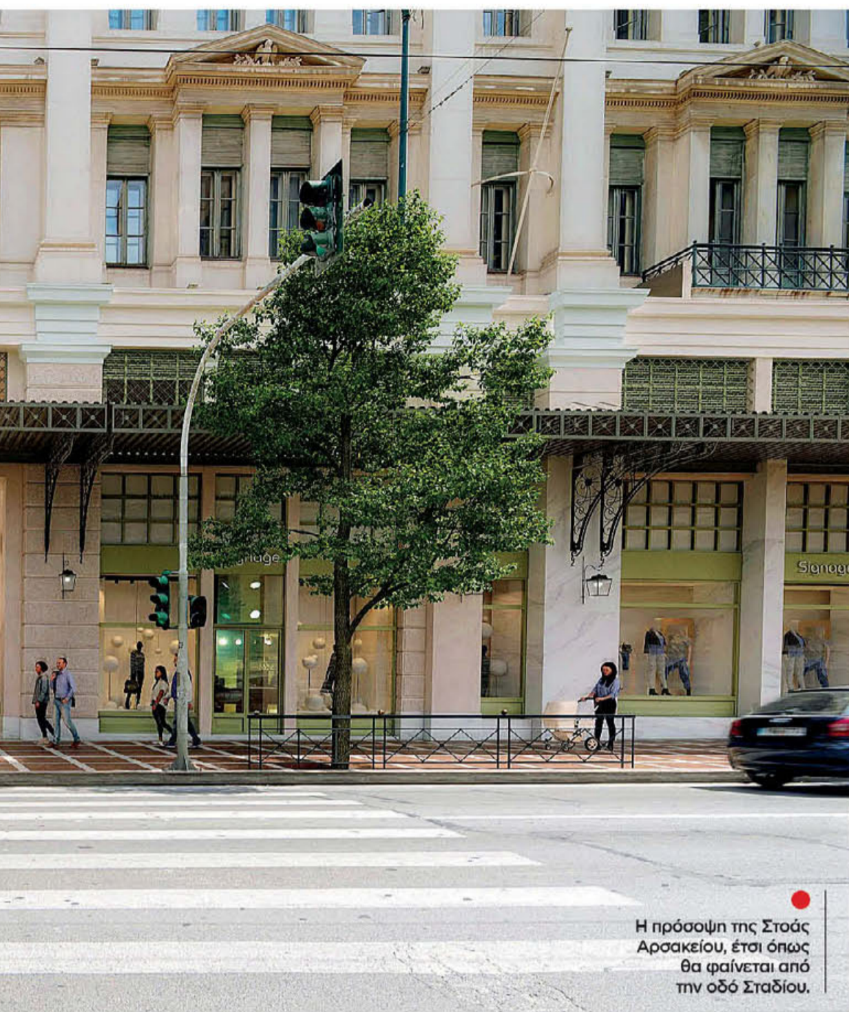
● Η πρόσοψη της Στοάς Αρσακείου, έτσι όπως θα φαίνεται από την οδό Σταδίου.