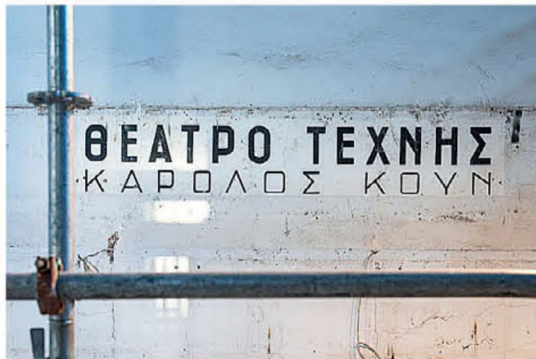
● Η παλιά πινακίδα του Θεάτρου Τέχνης Καρόλου Κουν που αποκαλύφθηκε κατά τη διάρκεια εργασιών στο κτίριο.

Ενα ολόκληρο οικοδομικό τετράγωνο στο κέντρο της πρωτεύουσας ετοιμάζει δυναμική επιστροφή στην πολιτιστική, γαστρονομική και εμπορική ζωή της πόλης. Περιηγηθήκαμε στους χώρους της Στοάς Αρσακείου και μιλήσαμε με τους ανθρώπους που συνδέονται με την ιστορία και τη νέα εποχή του κτιρίου.