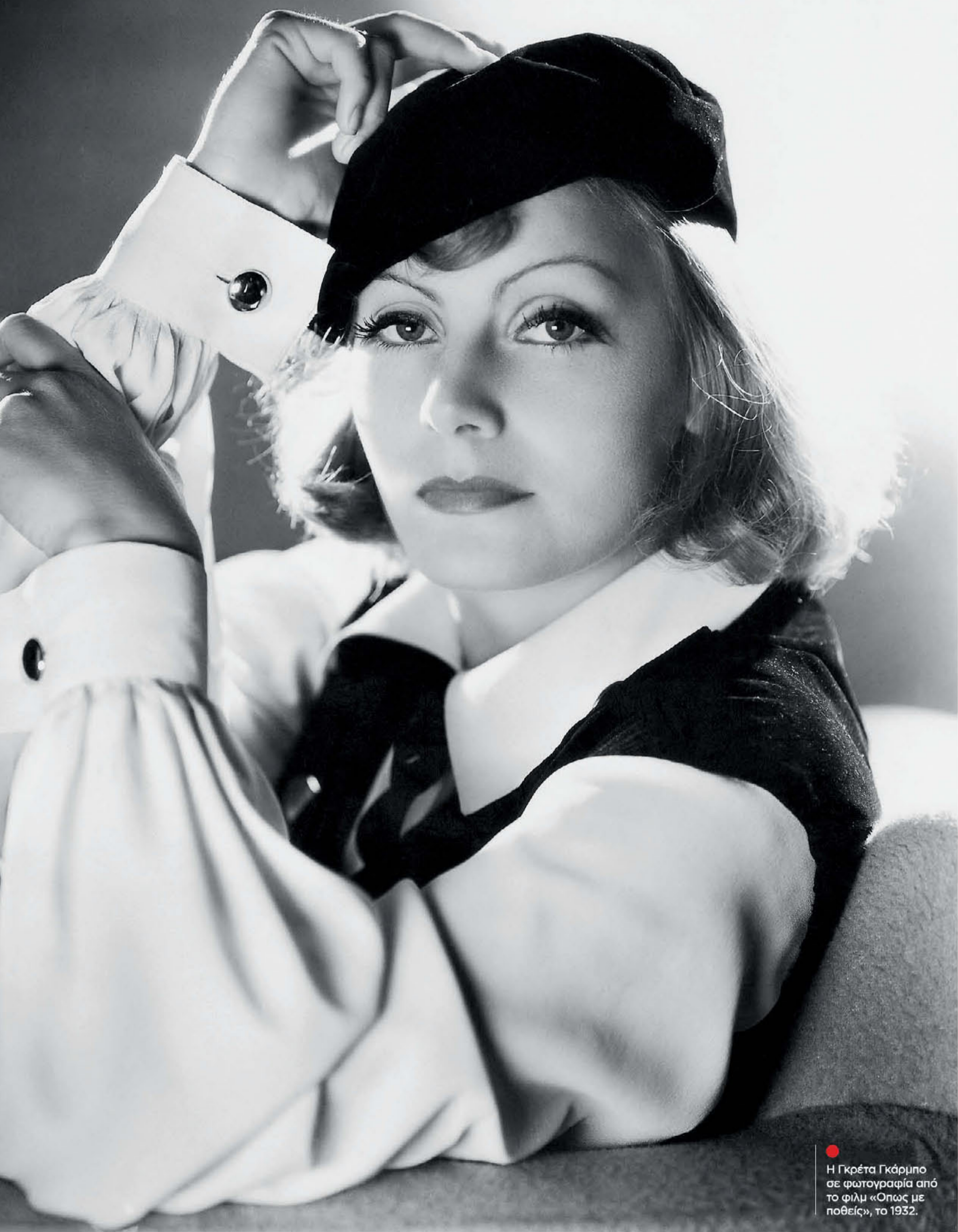
● Η Γκρέτα Γκάρμπο σε φωτογραφία από το φιλμ «Όπως με ποθείς», το 1932.