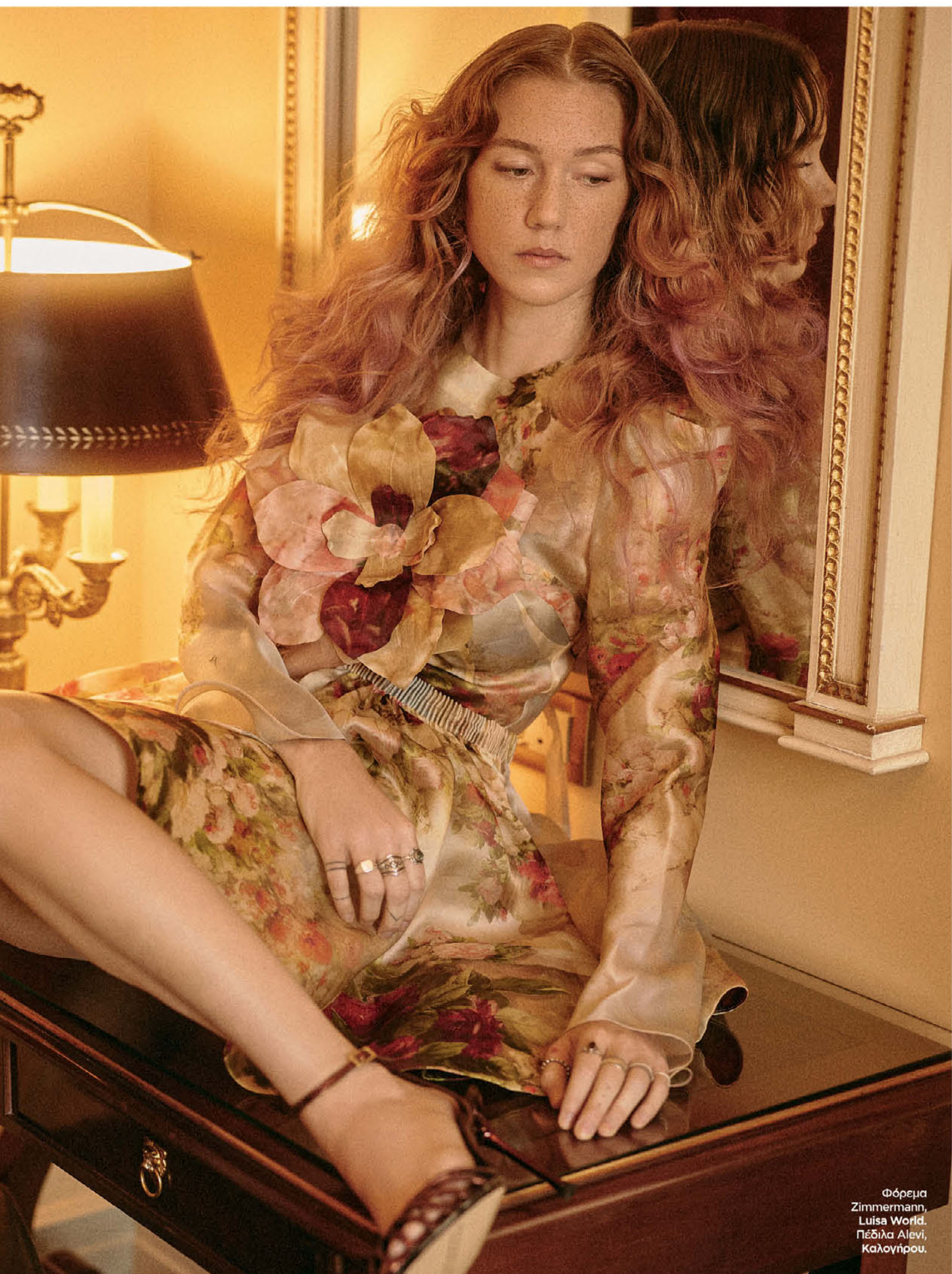
Φόρεμα Zimmermann, Luisa World. Πέδιλα Alevi, Καλογίρου.