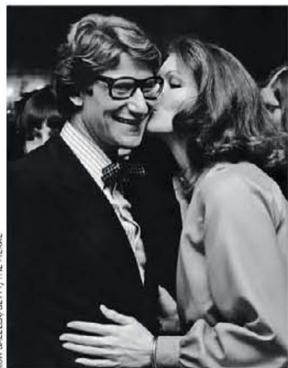
Ο Ιβ Σεν Λοράν και η Λόις Τσάιλις στο fashion show του πρώτου, το 1974, στο Pierre.

Μεγαλωμένος σε οικογένεια ιδιοκτητών εστιατορίων, με μικρή θητεία στο Hotel Anglais στο Μόντε Κάρλο και αφού σπούδασε την τέχνη της μαγειρικής στο Παρίσι, ο Σαρλ Πιερ Κασαλάσκο έφτασε στη Νέα Υόρκη σε ηλικία μόλις 25 ετών, προκειμένου να εργαστεί στο εστιατόριο του Λούις Σέρι, τον οποίο είχε γνωρίσει στο Λονδίνο. Εκεί συντόμευσε το όνομά του σε Σαρλ Πιερ και ήρθε σε επαφή με ισχυρούς ανθρώπους της πόλης, νεαρούς εκατομμυριούχους όπως ο Τζ. Π. Μόργκαν και γόνους αμερικανικών δυναστειών όπως οι Αστορ και οι Βάντερμπιλντ. Χάρη σε αυτές τις γνωριμίες του θα συνεργαζόταν αργότερα με τους Οτο Καν, Φίνλεϊ Σέπαρντ, Εντουαρντ Χάτον, Γουόλτερ Κράισλερ και Ρόμπερτ Λίβινγκστον Τζέρι, χρηματοπότες της Wall Street οι οποίοι χρηματοδότησαν την οικοδόμησή του Pierre Hotel, πάνω στην οικογενειακή έπαυλη του τελευταίου.