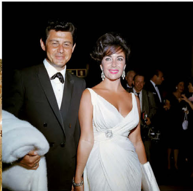
Αριστερά: Τις τοιογραφίες στη Ροτόντα ζωγράφισε ο Εντουαρντ Μέλκαρθ. Επάνω: Η Ελιζαμπεθ Τέιλορ, που το 1959 αγόρασε διαμέρισμα στο ξενοδοχείο The Pierre, με τον τέταρτο σύζυγό της, Εντι Φίσερ.