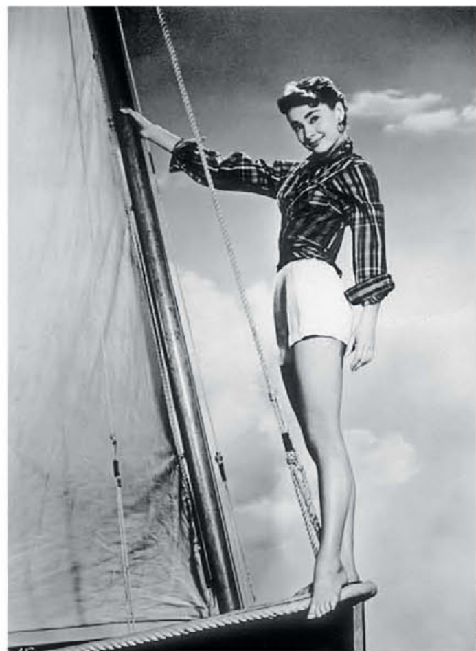
● Καλοκαιρινή πόζα της Οντρέϊ Χέμπορν για την προώθηση της ταινίας «Γλυκιά μου Σαμπρίνα».

καμε για λίγο στην Ισπανία, ας θυμηθούμε και την επίσης ηλιόλουστη Μαδρίτη, όπου η Οντρέϊ Χέμπορν το 1966 θα στεκόταν άτυχη ενώ περνούσε ξέγνοιαστα τις διακοπές της και δεν θα κατάφερνε να αποφύγει τους παπαράτσι.