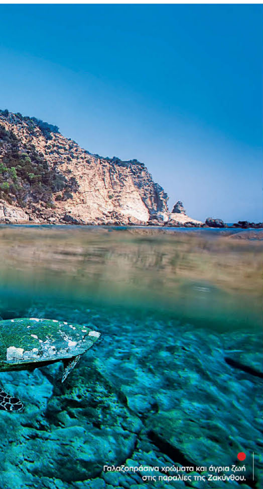
Γαλαζοπράσινα χρώματα και άγρια ζωή στις παραλίες της Ζακύνθου.

την εξερεύνησή του θα πάρτε από τα καταδυτικά κέντρα που δραστηριοποιούνται στην περιοχή. Ο Λεφτιός Γιαλός, ο Άγιος Δημήτριος, η Μηλιά, η Χρυσή Μηλιά, η Μεγάλη Αμμος και οι αμμουδιές γύρω από το Κοκκινόκαστρο δροσίζουν με τα πεντακάθαρα νερά τους τους επισκέπτες που θα προτιμήσουν ένα ήρεμο μπάνιο μετά ηλιοθεραπείας για την απαραίτητη βιταμίνη D από την «περιπέτεια» μιας κατάδυσης.