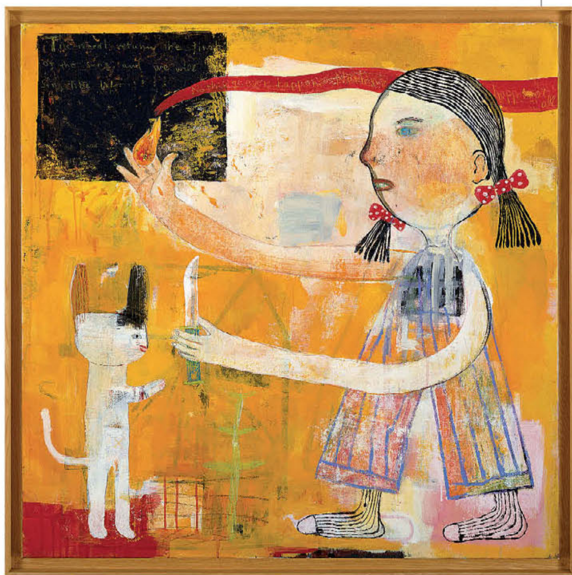
«Little Thinker in the Garden» (2016).

Τα έργα παρουσιάζονται χωρίς χρονολογική σειρά, μια και το ζητούμενο για τον Νάρα είναι να εστιάσει σε ζητήματα που αφορούν τη δημιουργική του διαδικασία μέσα από έξι ενότητες που περιλαμβάνουν τις επαναλαμβανόμενες θεματικές, τη φορμαλιστική εξέλιξη και τις ποικίλες τεχνικές του. Για παράδειγμα, ακρυλικά χρώματα σε καμβά σε έργα όπως το πολύ γνωστό «Missing in action» (1999) με το άτακτο βλέμμα του μικρού κοριτσιού (στην ενότητα «Searching for what was missing») ή το γλυπτό-σιντριβάνι «Fountain of life» (στην ενότητα «Thinking in silence»). Η έκθεση συνοδεύεται από ένα soundtrack 25 τραγουδιών με προσωπικές επιλογές από τα ταξίδια του στην Ευρώπη τη δεκαετία του '80, με τραγούδια από συγκροτήματα και καλλιτέχνες όπως οι The Beatles, David Bowie, T. Rex, The Roosters, The Clash, Nirvana, Skeeter Davis κ.ά. Αλλωστε, το πάθος του για τη μουσική είναι με πολλούς τρόπους παρόν στην έκθεση.