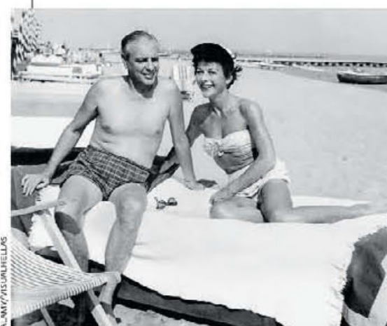
● Η θρυλική star Χέντι Λαμάρ μετά του συζύγου της στο Σαν Ρέμο.