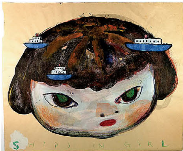
Ο πίνακας «Ships in Girl» (1992).

τον Τακάσι Μουρακάμι, και επιδίδεται στην παραγωγή πολύχρωμων κοκτέιλ high και low art, με υλικά τη ζωγραφική των κινουμένων σχεδίων anime, των κόμικς manga και τις παραδοσιακές ιαπωνικές ξυλογραφίες. Ομως ο 64χρονος Νάρα ανέκαθεν αναζητούσε και κάποιο βάθος κάτω από την επιφάνεια. Γι' αυτό και μια λίγο πιο προσεκτική εξέταση αποκαλύπτει ένα βαθύτερο, πιο σύνθετο συναισθηματικό τοπίο των μικρών παιδιών στους πίνακές του, που ξεφεύγει από το επιφανειακό, ανέφελο cuteness. Από την ένταση της ενδοσκόπησης, στη μελαγχολία, στη θλίψη, στην περιφρόνηση, στη διαβολική αταξία ή στον υπέρβοντα θυμό, τα παιδιά στα έργα του Νάρα είναι ελεύθερα να εκφράσουν τα πολύπλοκα, συνήθως μη «αποδεκτά» συναι-