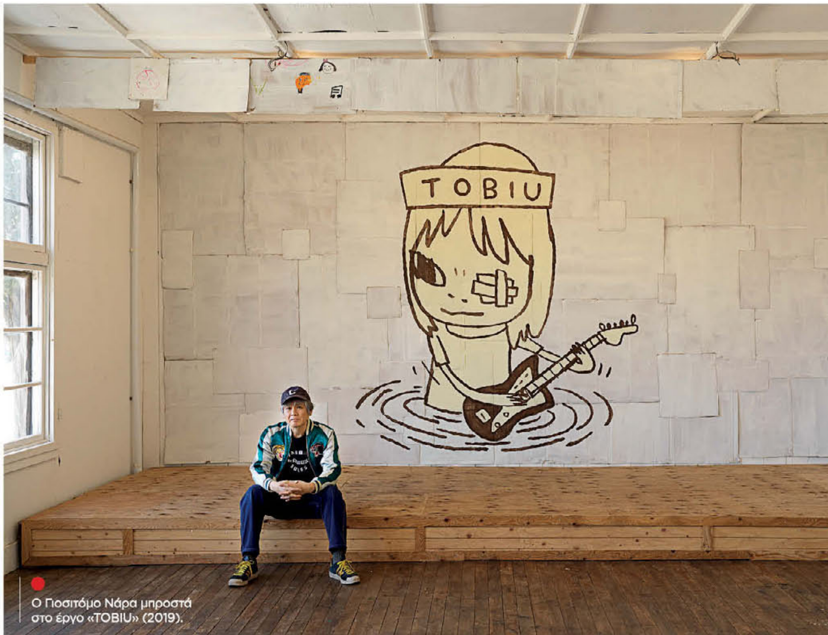
Ο Γιοσιτόμο Νάρα μπροστά στο έργο «TOBIU» (2019).

Την τέχνη του όλο και κάπου την έχεις δει, κάπου την έχει πάρει το μάτι σου, αν και είναι αμφίβολο να έχεις συγκρατήσει το όνομά του, πέρα από την αίσθηση ότι μάλλον θα πρόκειται για Ιάπωνα δημιουργό – είναι αυτή η kawaii, «γλυκούλα» αισθητική για την οποία είναι υπεύθυνη η συγκεκριμένη χώρα. Απεικονίζεις μικρών παιδιών – ή και ζώων – με μεγάλα, ανοιχτά μάτια, ενίοτε κατάπληκτα και φαινομενικά αθώα, που μοιάζουν να ξεπηδούν από καμβάδες με μονόχρωμα, επίπεδα φόντα. Ο Γιοσιτόμο Νάρα είναι μια εμβληματική μορφή του κινήματος Superflat, που έχει ως βασιλιά