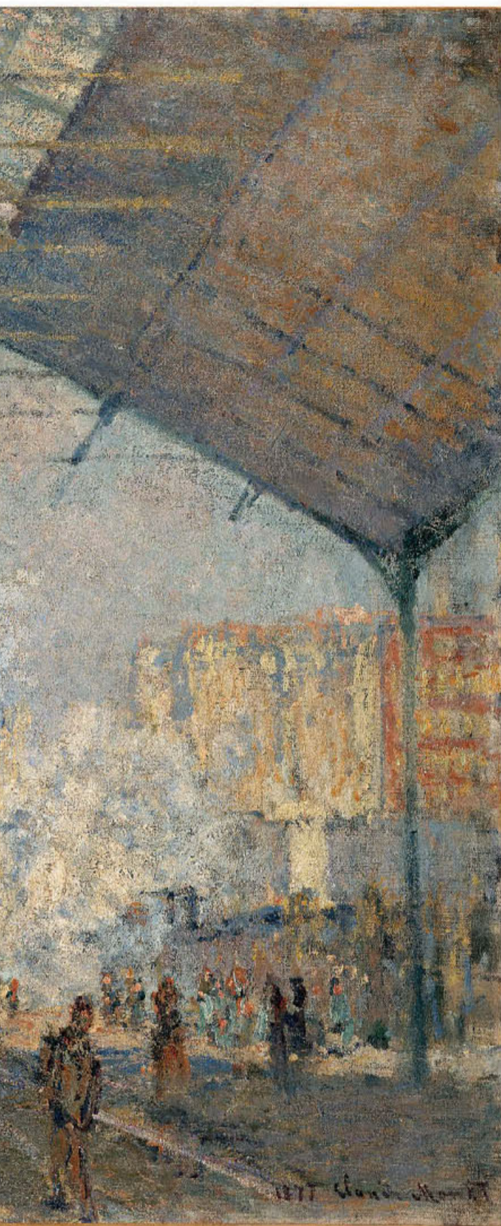
● Ο πίνακας «La Gare Saint-Lazare» (1877) του Κλοντ Μονέ θα παρουσιαστεί στην επετειακή έκθεση για τον Ιμπρεσιονισμό στο Μουσείο Ορσέ.