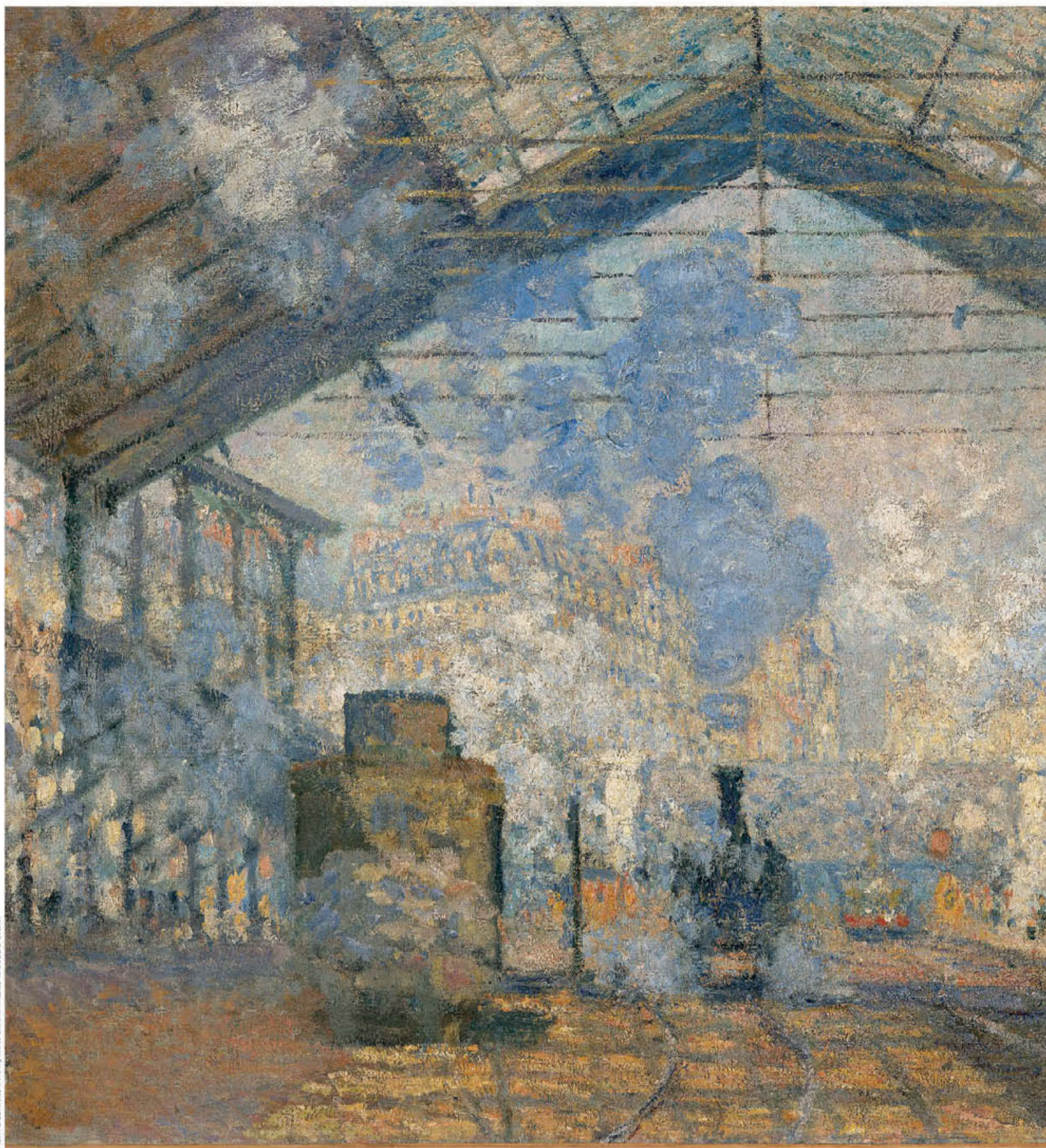
HERVE LEMARQUAND / RMN GRAND PALAIS - MUSÉE D'ORSAY

Με αφορμή τη συμπλήρωση 150 χρόνων από την πρώτη έκθεση των ιμπρεσιονιστών και τη «βάπτιση» του ιδιώματός τους, διοργανώνονται εκθέσεις και αφιερώματα απ' άκρη σ' άκρη της χώρας.