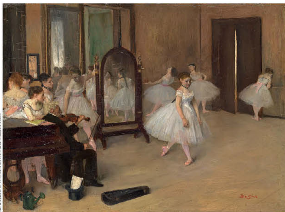
● «La Classe de danse» (n. 1870), του Εντγκάρ Ντεγκά.