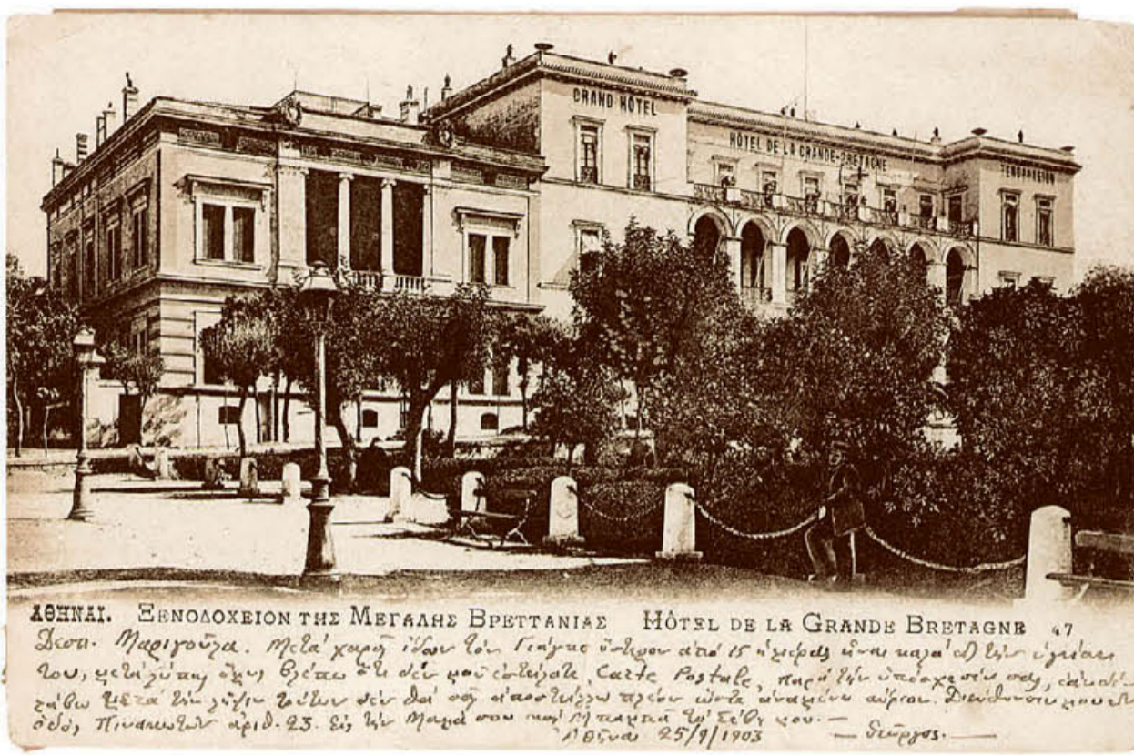
ΑΘΗΝΑΙ. ΞΕΝΟΔΟΧΕΙΟΝ ΤΗΣ ΜΕΓΑΛΗΣ ΒΡΕΤΤΑΝΙΑΣ HÔTEL DE LA GRANDE BRETAGNE 47 Διοστ. Μαριγούζα. Μετὰ χαρῆ ἴδων τὸν Γαίγυο ὄψων ἀπὸ 15 ἡμερῶν εἶ-αι κατὰ τὴν ἐξέδρα σου, ἐπιβίβου αὐτῆς θύρας εἰς τὴν καὶ ἐπιβίβου, Carte Postale, κατὰ τὴν ὑποχρέωσιν σου, ἐπιβίβου εἰς τὴν ἐξέδρα τὴν γαίγυο εἰς τὴν καὶ εἰς τὴν ἀποστολῆν σου εἰς τὴν ἀποστολῆν σου. Διεύθυνσις σου, Παναθηναίων ἀριθ. 25. εἰς τὴν Μαγὰ σου κατὰ τὴν παρὰ τὴν ἐξέδρα σου. — Διοστ. — 1895/25/9/1903

● Η επιβλητική πρόσοψη της Μεγάλης Βρεταννίας σε μορφή καρτ-ποστάλ, με ιδιόχειρο μήνυμα και ημερομηνία αποστολής 1903.