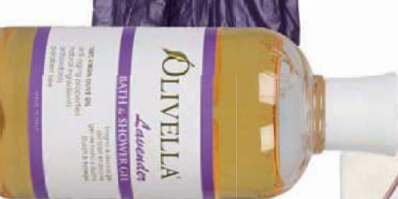
Σαμπουάν για τη μαμά, Olivella, €10,99, Βρεφικά Πολυκαταστήματα Λατώ.