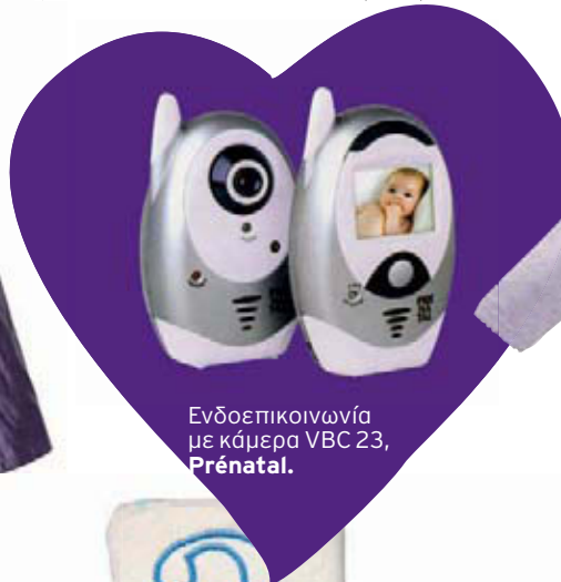
Ενδοεπικοινωνία με κάμερα VBC 23, Prénatal.