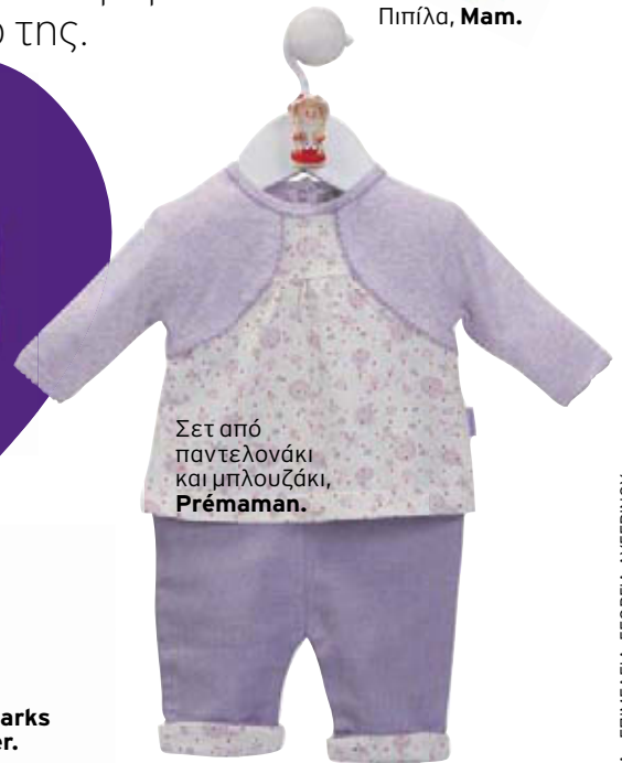
Σετ από παντελονάκι και μπλουζάκι, Prémaman.