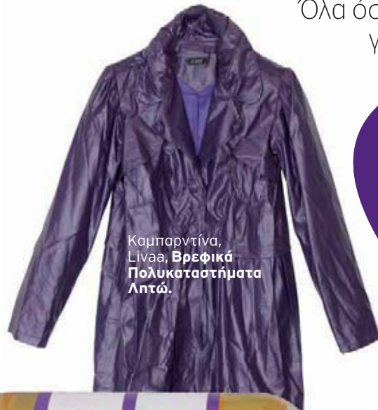
Καμπαρντίνα, Lίναα, Βρεφικά Πολυκαταστήματα Λατώ.