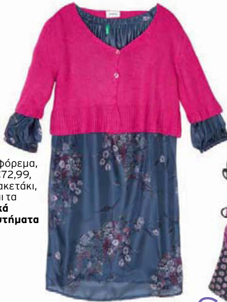
Μεταξωτό φόρεμα, Benetton, €72,99, και κοντό ζακετάκι, Balloom, και τα δύο Βρεφικά Πολυκαταστήματα Λατώ.